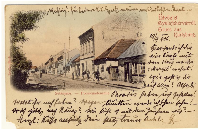
Fig. 6. Ilustrată. Alba Iulia. Promenada, 1900 (francată) Postcard. Alba Iulia. The promenade, 1900 (franked)