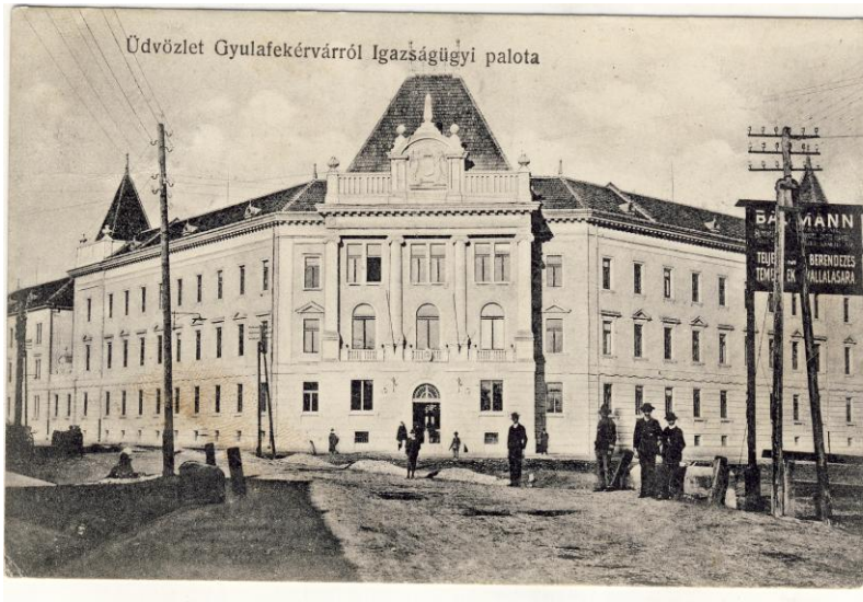
Fig. 3. Ilustrată. Alba Iulia. Palatul de Justiție, 1908 (francată) Postcard. Alba Iulia. The Justice Palace, 1908 (franked)