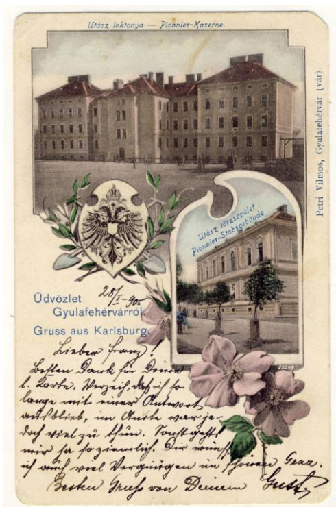
Fig. 7. Ilustrată. Alba Iulia. Cazarma Pionierilor, 1905 (francată); Postcard. Alba Iulia. The Pioneers' Barracks, 1905 (franked)