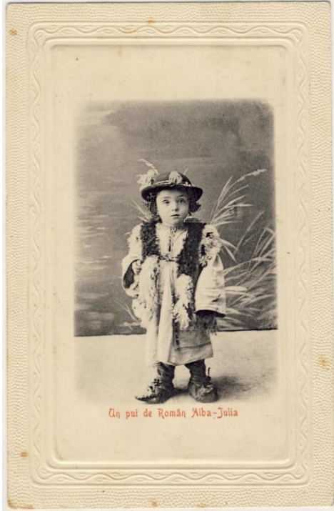
Fig. 9. Ilustrată. Alba Iulia. Catedrala romano-catolică, 1943 (nefrancată); Postcard. Alba Iulia. The Roman-Catholic Cathedral, 1943 (un-franked) Fig. 10. Ilustrată. Alba Iulia. Un pui de român, 1919 (nefrancată) ; Postcard. Alba Iulia. A Romanian child, 1919 (un-franked)