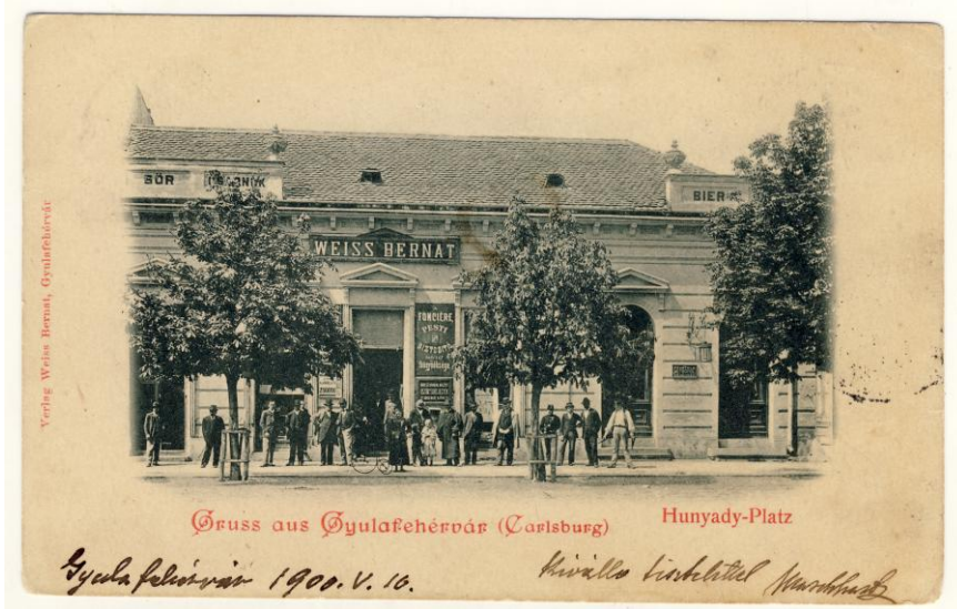
Fig. 5. Ilustrată. Alba Iulia. Piața Hunyady, 1900 (francată) Postcard. Alba Iulia. Hunyady Square, 1900 (franked)