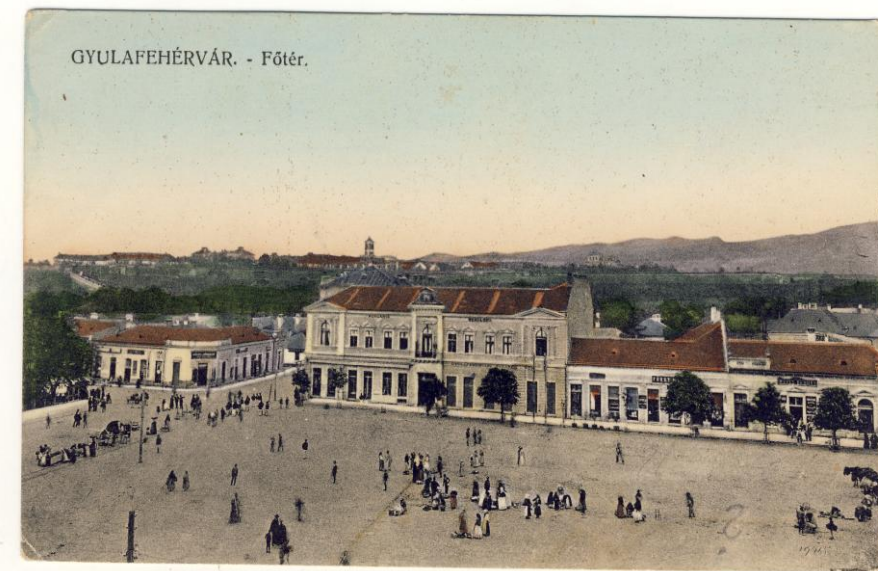
Fig 2. Ilustrată. Alba Iulia. Piața centrală, 1898 (francată) Postcard. Alba Iulia. The central square, 1898 (franked)