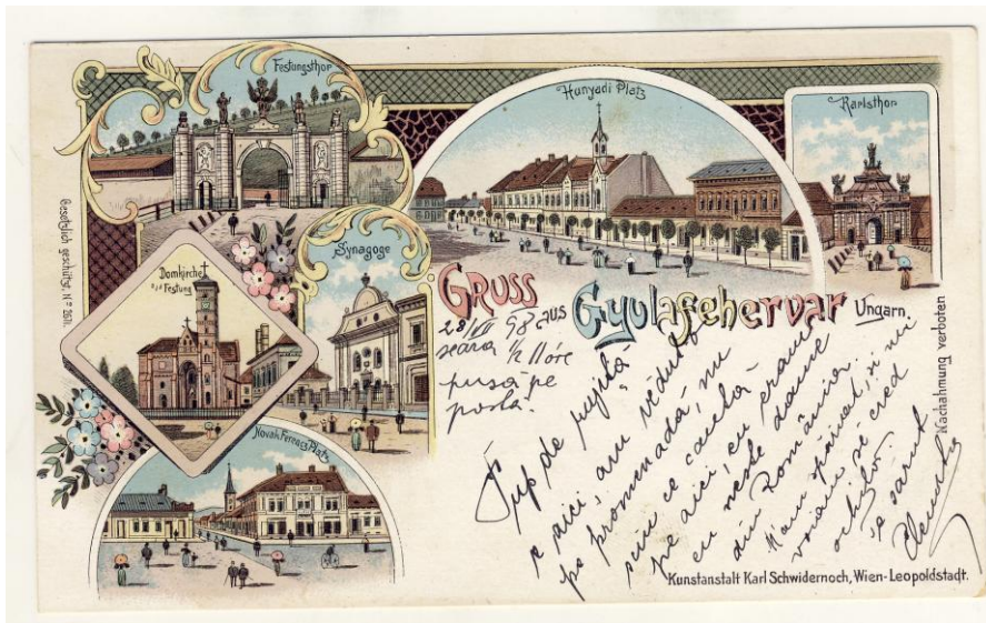
Fig 1. Ilustrată. Alba Iulia, 1898 (francată) Postcard. Alba Iulia, 1898 (franked)