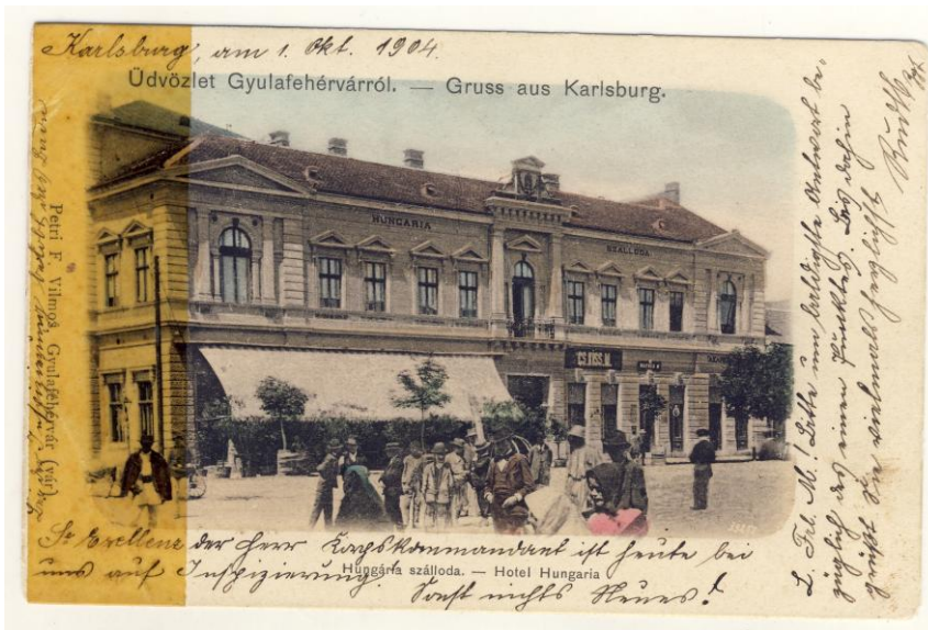
Fig. 4. Ilustrată. Alba Iulia. Hotelul Hungaria, 1904 (francată) Postcard. Alba Iulia. Hungaria Hotel, 1904 (franked)