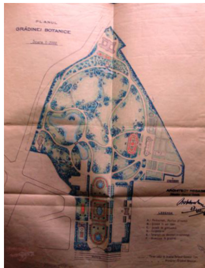
Fig. 3. Situația plajelor din București în anul 1930; The situation of beaches in Bucharest in 1930. Fig. 4. Planul Grădinii Botanice; The plan of the Botanical Garden.