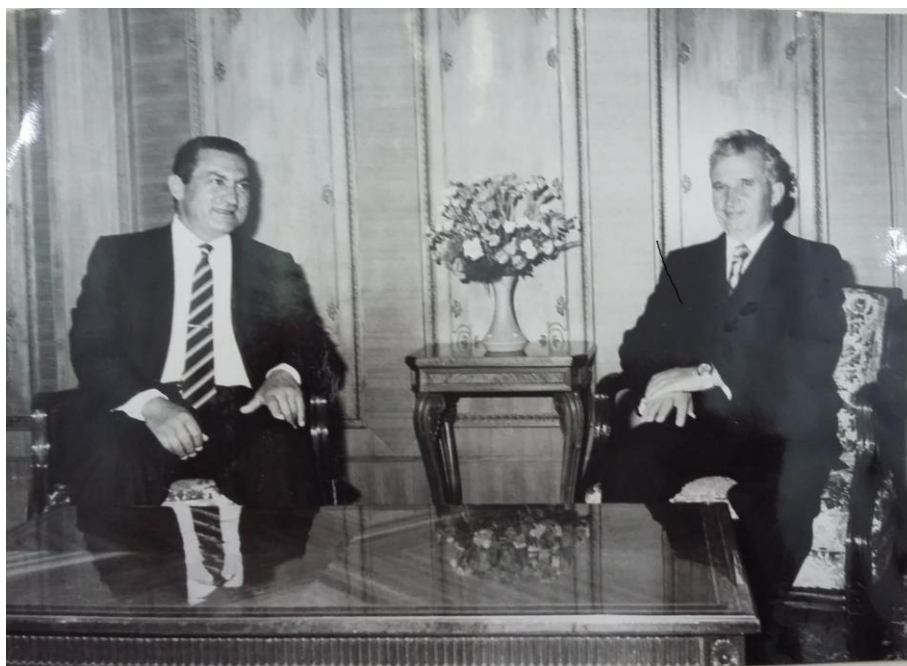
București, 9 septembrie 1982. Convorbiri oficiale între liderul român și cel arab