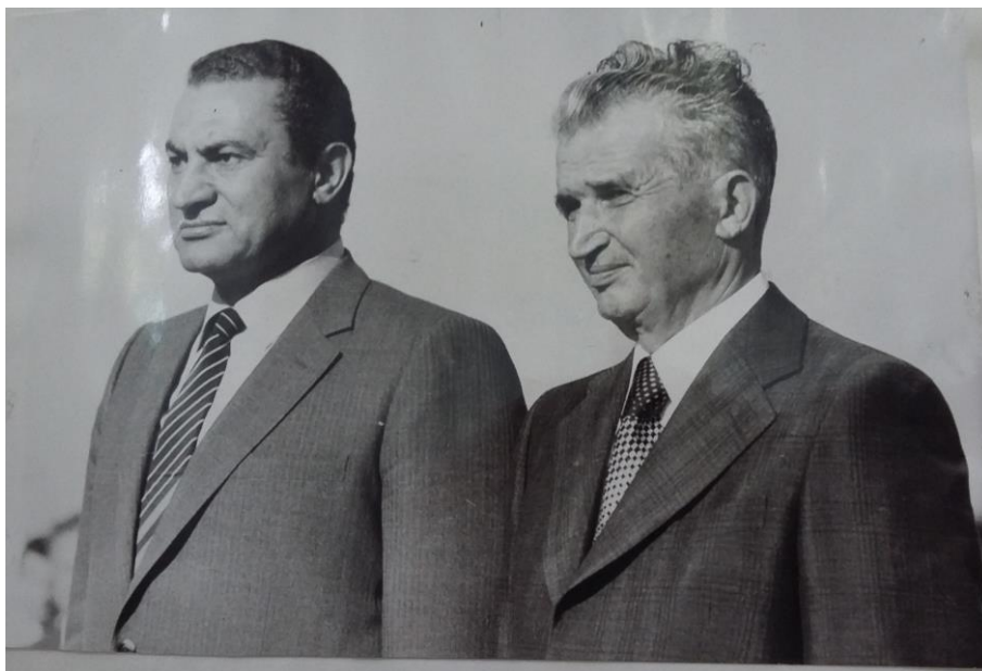
București, 8 septembrie 1982. N. Ceaușescu îl întâmpină pe H. Mubarak