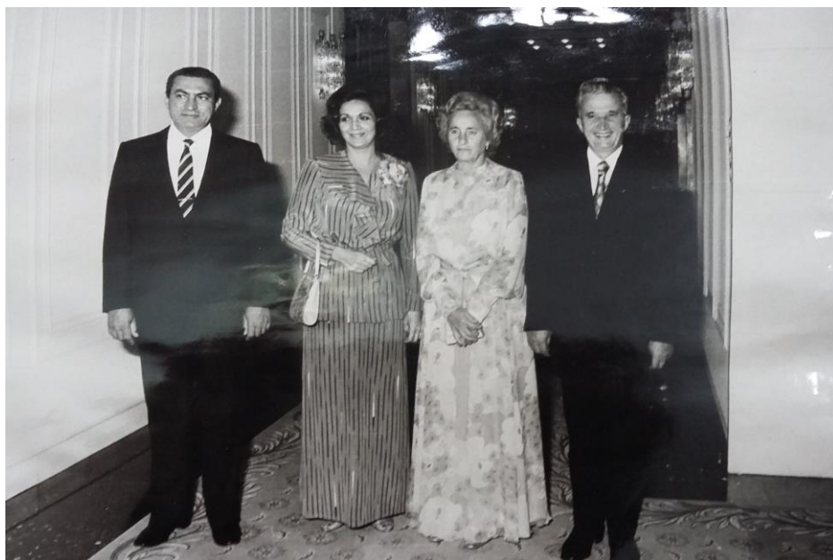
București, septembrie 1983. Dineu de gală la care participă familia Ceaușescu și familia Mubarak