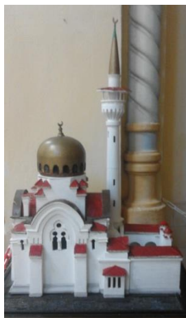
Macheta moscheii „Carol I” din Constanța