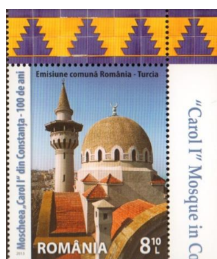
Marcă poștală neuzată; Emisiune comună România - Turcia. Moscheea „Carol I” din Constanța - 100 de ani (2013); MNIR

Toate obiectele prezentate în acest studiu (mărci poștale, colițe, întreguri poștale), fac parte din seriile neuzate pe care Romfilatelia le cedează Muzeului Național de Istorie a României, cu titlu gratuit, conform legii, valoarea lor crescând astfel în timp. În prezent, acestea sunt ambalate în plicuri și cutii personalizate, cu pH neutru, fiind păstrate în fișete securizate, într-o stare foarte bună de conservare. Albumele filatelice specifice celor trei emisiuni amintite au fost achiziționate de curând de muzeul nostru și vor face obiectul unui studiu viitor.