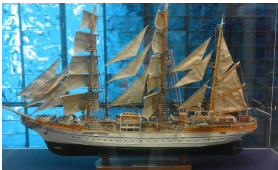
Macheta velierului „Mircea II”; expoziția permanentă a Muzeului Marinei Române