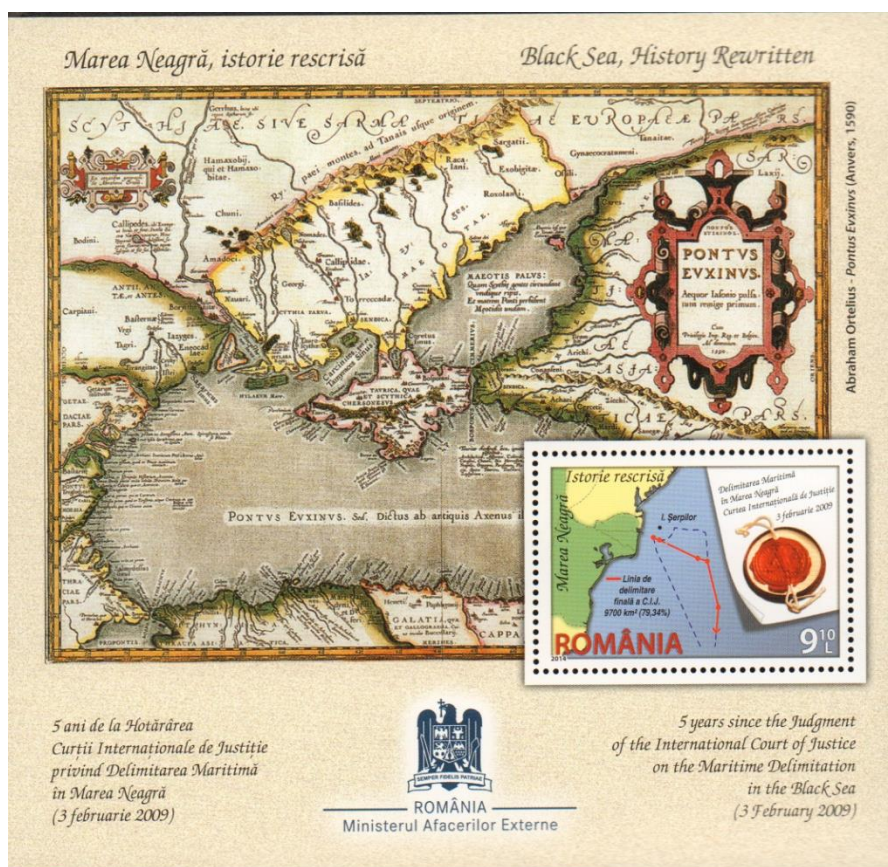
Coliță neuzată; Emisiunea Marea Neagră, istorie rescrisă (2014); MNIR