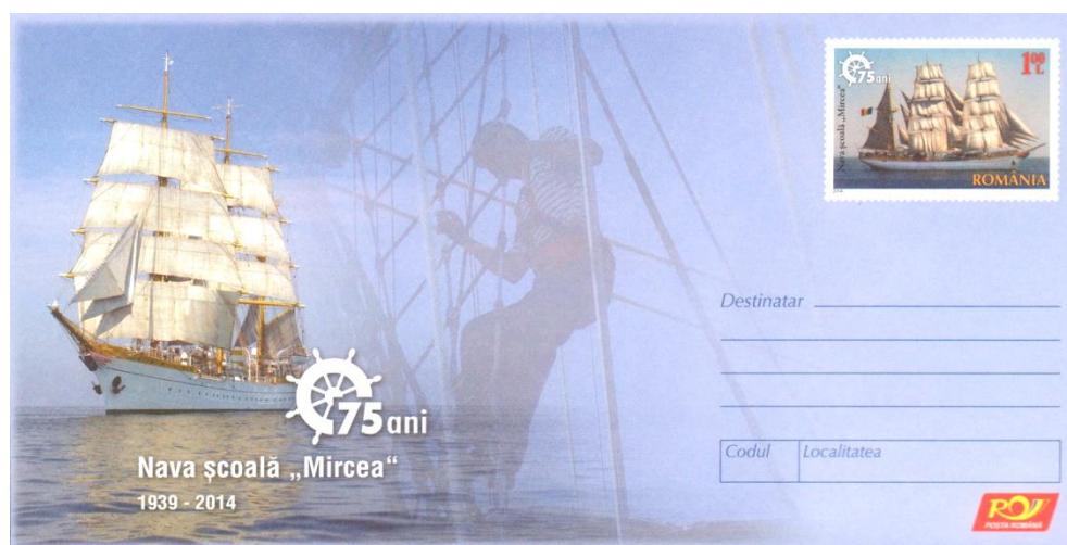
Întreg poștal; Emisiunea Nava școală „Mircea” - 75 de ani (2014); MNIR