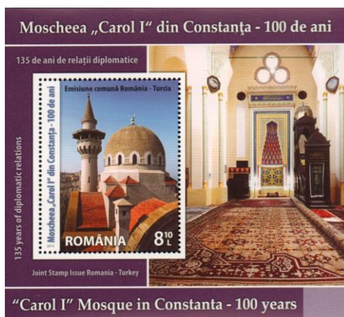
Coliță neuzată; Emisiune comună România - Turcia. Moscheea „Carol I” din Constanța - 100 de ani (2013); MNIR

Vezi http://www.navy.ro/comunicate/2017/05/19051701.php ; https://www.agerpres.ro/justitie/2017/05/23/constanta-nava-scoala-mircea-pleaca-intr-un-mars-international-de-instructie-de-10-000-de-mile-marine-05-18-04