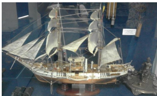
Macheta velierului „Mircea I”; expoziția permanentă a Muzeului Marinei Române