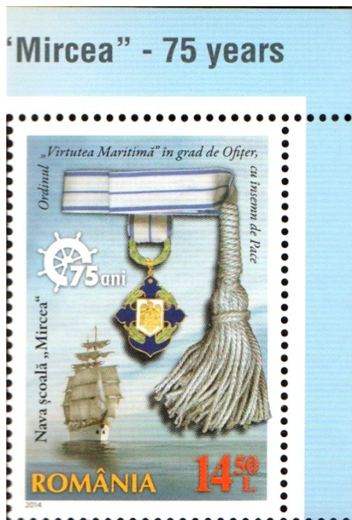
Marcă poștală neuzată; Emisiunea Nava școală „Mircea” - 75 de ani (2014); MNIR