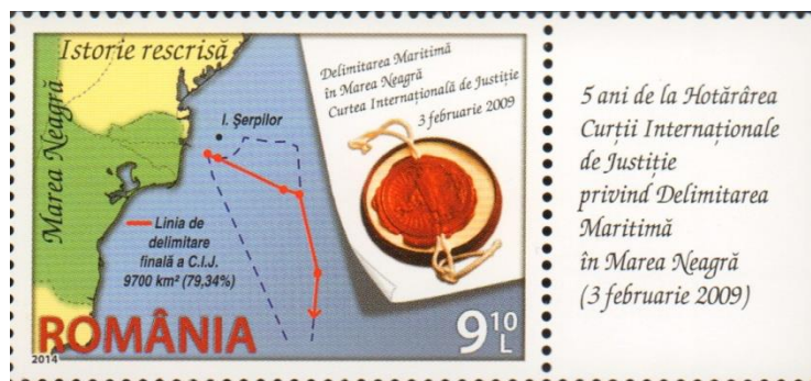
Marcă poștală neuzată; Emisiunea Marea Neagră, istorie rescrisă (2014); MNIR