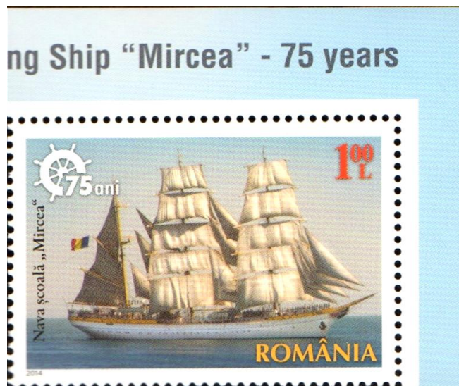
Marcă poștală neuzată; Emisiunea Nava școală „Mircea” - 75 de ani (2014); MNIR