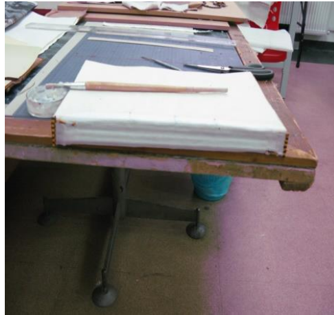
Fig. 11. Căptușire cotor interior