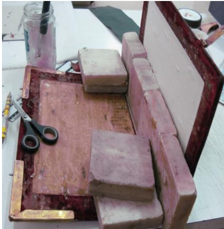
Fig. 10. Montare cotor nou