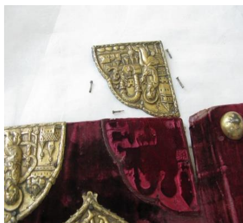
Fig. 7. Demontare orfevrărie