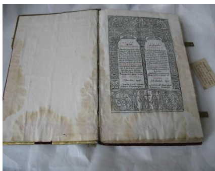
Fig. 2. Prima filă și forzaț