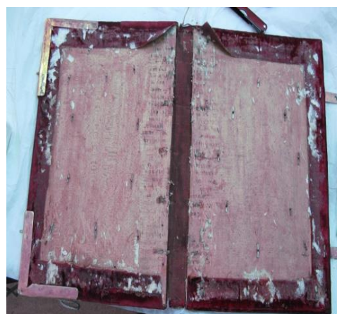
Fig. 9. Scoarțe curățite