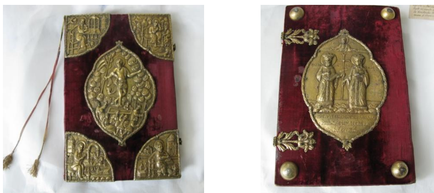
Fig. 1a-b. Vedere de ansamblu a cărții înainte de restaurare

Keywords: restoration, handmade paper, gospel, immersion, wood bark, orfevrarie, Japanese paper, ribbons, velvet, wax deposits, neutralization.