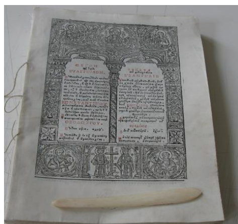
Fig. 8. Relegare carte