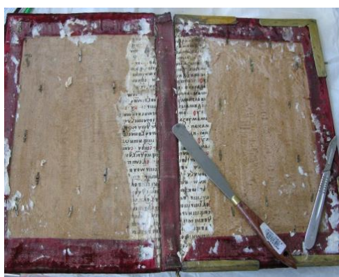
Fig. 4. Scoarțe de lemn