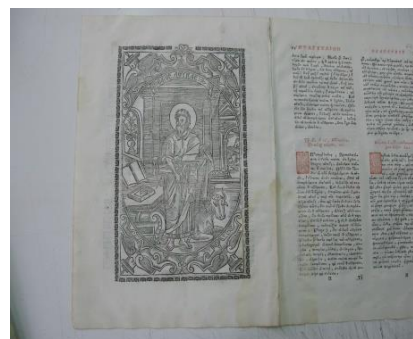
Fig. 3. Gravură în primă pagină

Cartea are scoarțele confecționate din lemn de esență tare, învelite în material textil, și anume o catifea de culoare roșu închis. Pe această învelitoare se află o ferecătură din argint-aurit (materialele au rezultat în urma analizelor), pe coperta anterioară, în centru, avem o reprezentare de formă ovală ce are în prim plan învierea lui Iisus Hristos, scena în care se află deasupra coșciugului, și în cele patru colțuri avem reprezentați cei patru apostoli. Pe coperta posterioară se află în centru aceeași formă ovală, în care sunt gravați Constantin Brâncoveanu și soția sa Maria, dedesubt având un text chirilic, în cele patru colțuri se află patru buloane, având rolul de piciorușe. Cartea are încuietori din același material, argint-aurit. Scoarțele au fost executate în anul 1692, pe când blocul cărții a fost tipărit în anul 1693, de către Antim Ivireanul. Sunt prezente în interiorul cărții câteva xilogravuri, tipărite cu cerneală neagră. Din analizele efectuate, cerneala roșie este pe bază de cinabru, iar cu ea sunt tipărite literele de la începutul rândurilor, și titlurile capitolelor. În partea de sus a celei de-a 18-a file a manuscrisului, deținut de MNIR, tăiată și păstrată doar în partea superioară, avem următoarea însemnare a domnitorului: „Sept 6, miercuri am sosit la mănăstire la Hurezi, unde mănăstirea [biserica și incinta principală] am târnosit la septembrie 8 vineri în ziua nașterii Maicăi Precaste”.