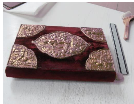
Fig. 13. Cartea restaurată la finalul restaurării