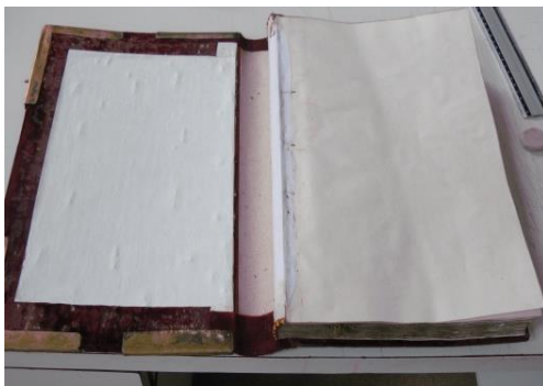
Fig. 12. Cotor nou montat