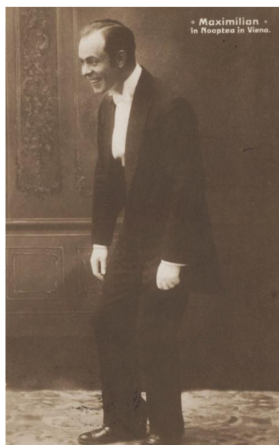
Fig. 24. - Maximilian