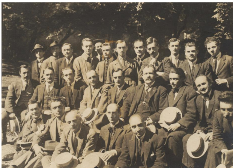
Fig. 1. - Compañia Grigoriu