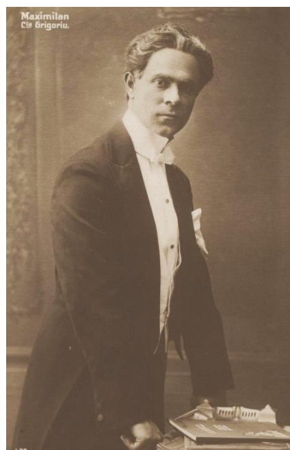
Fig. 26. - Maximilian