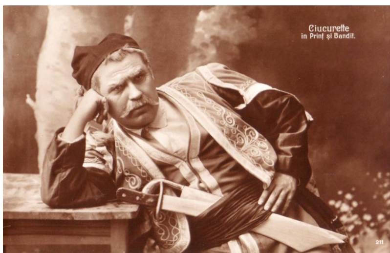
Fig. 4. – Ciucurette