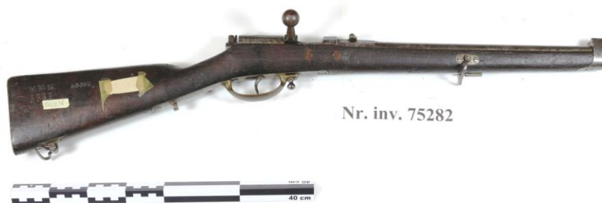
Fig. 10. Carabina Dreyse M-1857 înainte de restaurare

Pentru depozitarea armei se recomandă, o verificare periodică și menținerea unui microclimat optim.