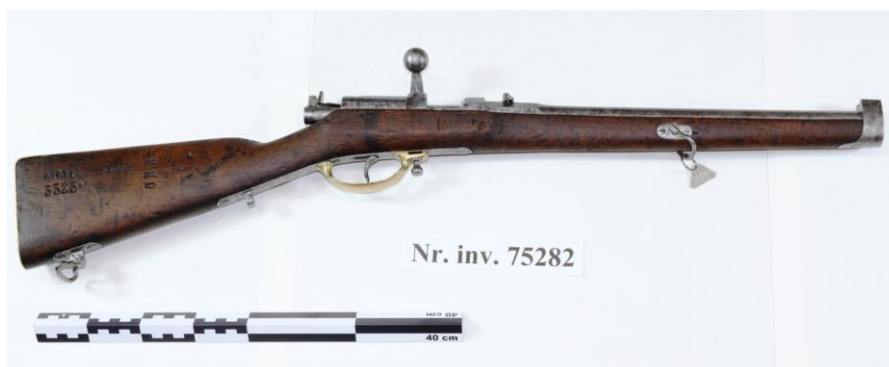
Fig. 11. Carabina Dreyse M-1857 după restaurare