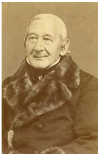
Fig. 2. Johann Nikolaus von Dreyse

În anul 1824, von Dreyse se va întoarce în Prusia, la Sömmerda, unde va începe pe cont propriu producția de arme.