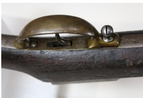
Fig. 4. Trăgaciul și garda înainte de restaurare

Mecanismul de tragere este nefuncțional, dar complet. Piesele din alamă prezintă produși de coroziune specifici cuprului.