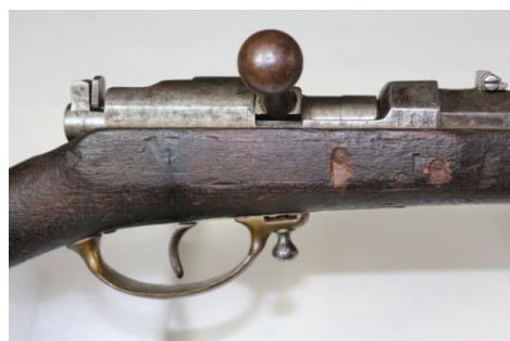
Fig. 5. Închizătorul și camera de ardere înainte de restaurare