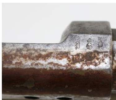
Fig. 7. Detaliu, produși de coroziune