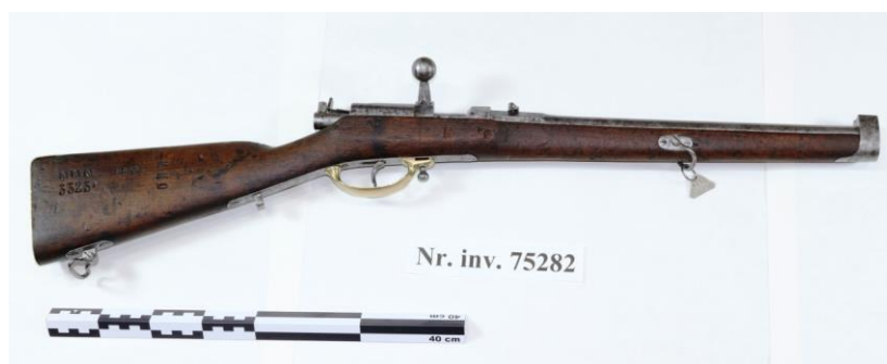
Fig.1. Carabina Dreyse M-1857

Keywords: weapon, restoration, carbine, corrosion, Dreyse.