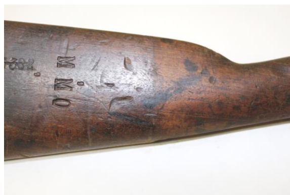
Fig. 9. Detaliu, curățare pat din lemn

Piesele din fier și alamă au fost imersate în soluție de EDTA concentrație 3% (Acidul etilendiaminotetraacetic), în băi succesive de 10-15 minute, urmate de perieri ușoare. Părțile componente din fier au fost curățate mecanic cu lână de oțel și conservate cu ulei pentru mecanisme fine.