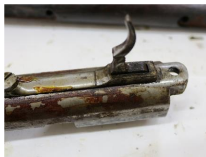
Fig. 8. Detaliu, produși de coroziune și vaselină ancrasată