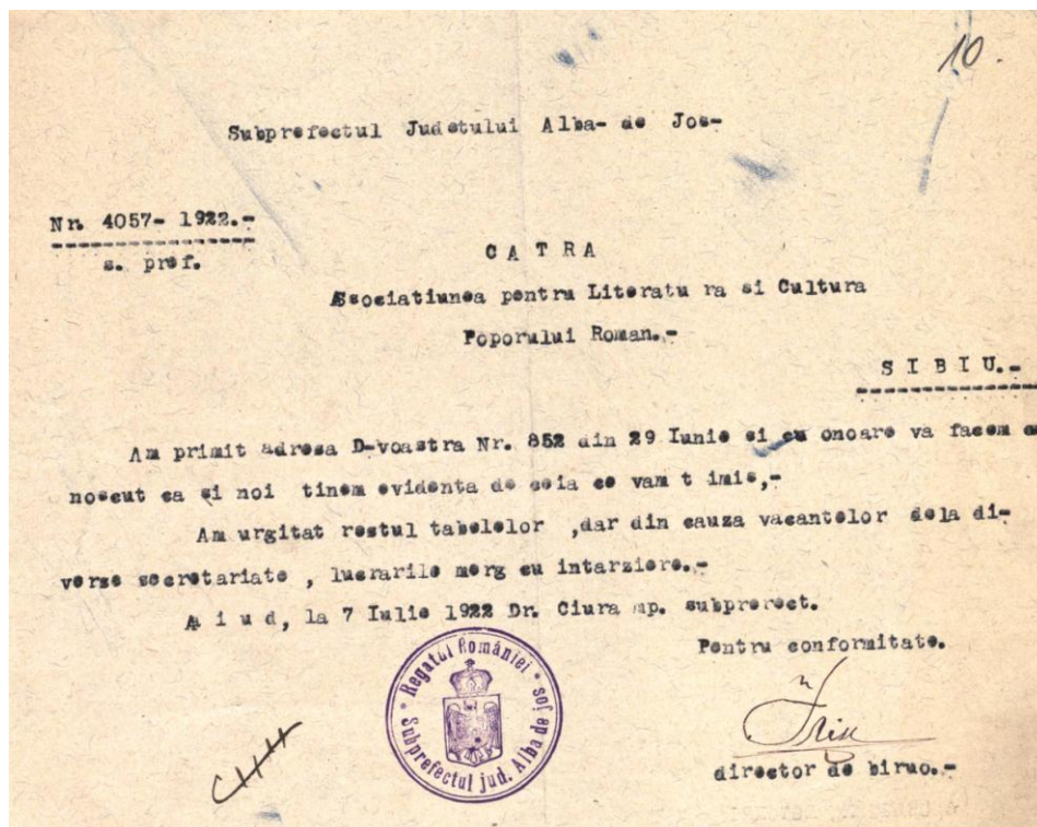
1. - Adresa subprefectului județului Alba de Jos, către ASTRA, SJANSB, FA, 1a, f. 10r