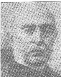
Nicolae KRETZULESCU (1812-1900)

Este socotit a fi fost primul medic din Muntenia care a avut ideea înființării unei școli sanitare elementare, care să scoată ajutoare pentru medicii ce practicau în principate.