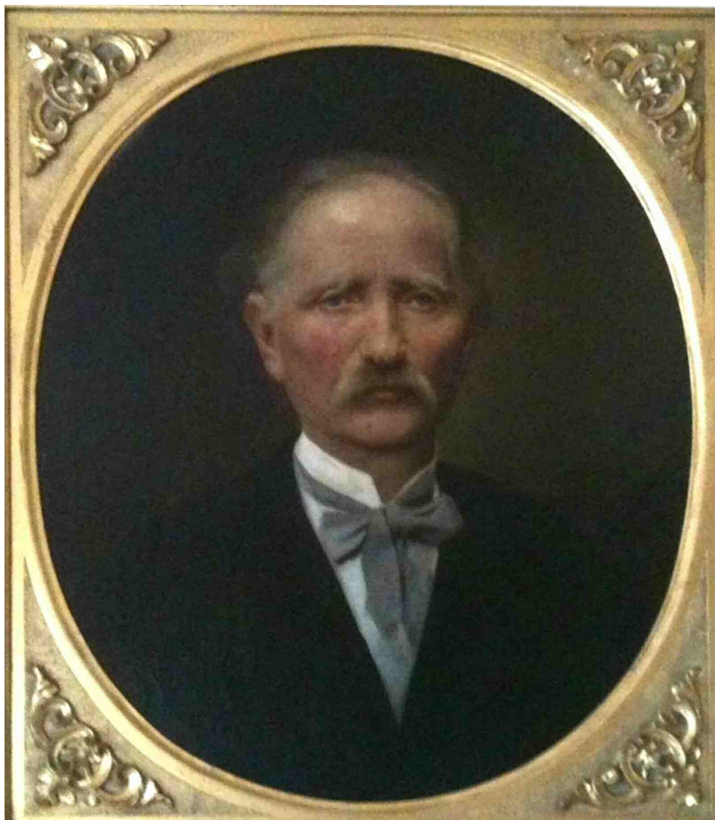
Fig. 1 Baronul Jacob de Neuschotz