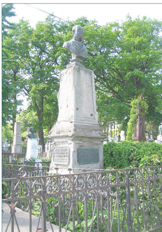
Fig. 2. Monumentul de pe mormântul lui Teodor Tăutu de pe aleea centrală din Cimitirul „Eternitatea”

Una dintre fete, Marghiolița, ar fi fost născută, după același raport, în 1834 (având opt ani în 1842). Dar un document nemțesc (adică austriac) o anunța în martie 1857 că poate ridica de la Agenția Consulară Austriacă o sumă depusă pe numele ei întrucât a împlinit vârsta de 27 de ani 43 . Era deci născută la 1830 ?! Marghiolița (Maria) se va căsători în 1856