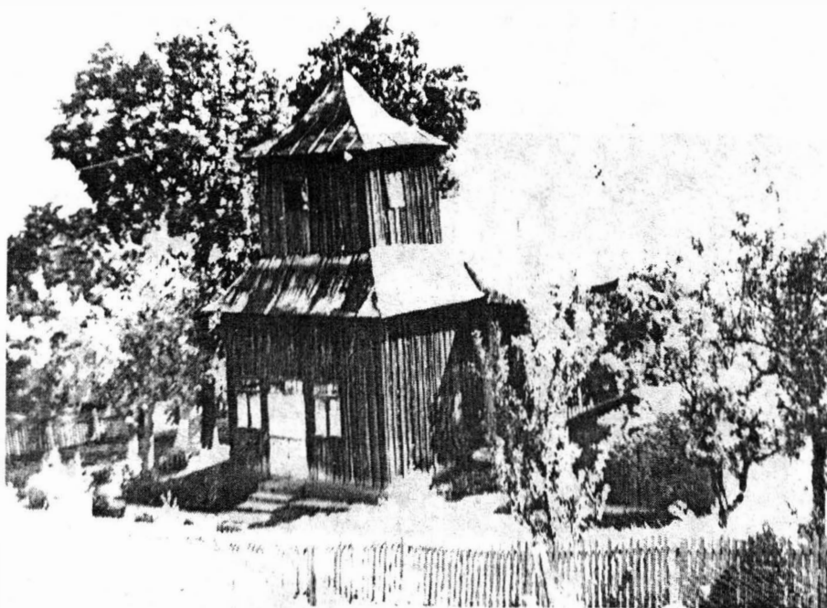
Biserica Sf. Dimitrie din Obrieni (com. Popești, jud. Iași) = Vedere exterioră