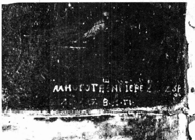
Biserica Sf. Dimitrie din Obrijeni (com. Popești, jud. Iași) – Detaliu cu inscripția lui Ursu Zugravul de pe icoana de hram