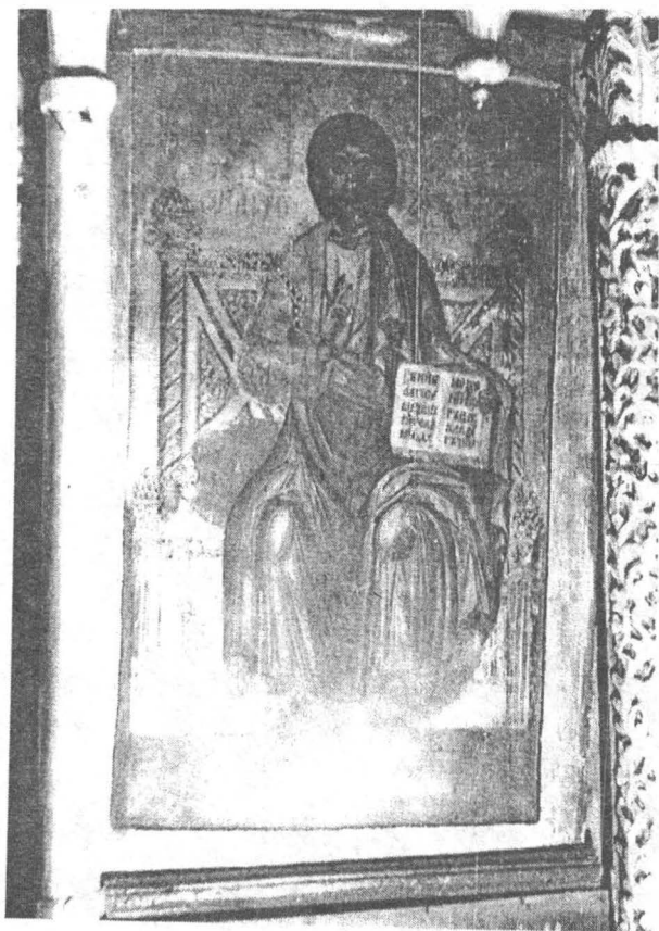
Iisus Hristos Pantocrator (icoană împărătească)