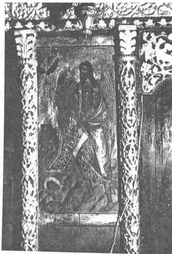
Sf. Ioan Botezătorul (icoană împărătească)