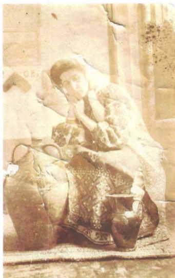
Ecaterina Sturdza Cantacuzino. Muzeul de Istorie a Moldovei

Prințesa Ecaterina Sturdza Cantacuzino poza gânditoare, la începutul secolului XX, la castelul Miclăușeni, în costum popular cu broboadă de borangic pe cap și cu salbă la gât, într-un cadru tradițional, alături de două vase ceramice pe un covor gros de rafie.