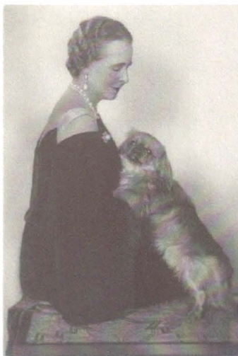
Regina Maria. Carte poștală deținută de Muzeul de Istorie a Moldovei