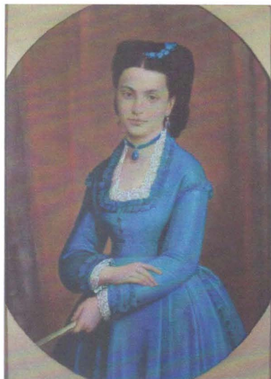
Gheorghe Tattarescu (1820-1894) - Femeia în albastru. Muzeul de Artă Iași

în albastru , aflată în prezent în colecția Muzeului de Artă din Iași. Tânăra pictată de artist purta o rochie albastră cu turnură, iar garnitura detașabilă era din dantelă albă.