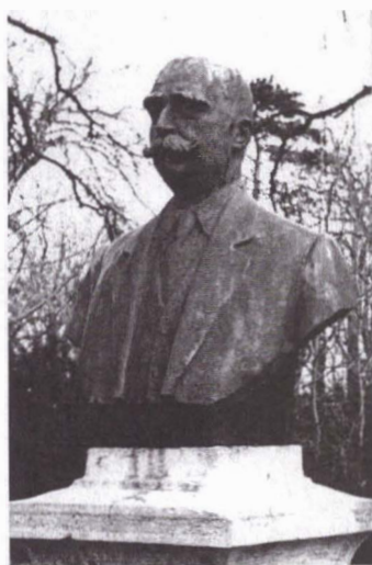
Fig. 1 - Bustul lui Gh. Ghibănescu (1938).

și fost publicate în paginile publicației amintitei Societăți (care se numea tot „Viitorul”), după ce fuseseră citite în sala de conferințe a Seminarului „Veniamin Costachi” (fostul palat al domnitorului Mihail Sturdza, ce găzduiește astăzi Facultatea de Teologie Ortodoxă). S-au bucurat de atenție, pe rând, bisericile ieșene 40 de Sfinți 11 , Sf. Neculai cel Sărac 12 , de la poalele Copoului, Sf. Haralambie 13 , Sf. Lazăr 14 , Sf. Teodori 15 , Sf. Neculai cel Bogat (Domnesc) 16 și Trei Ierarhi 17 . În anii următori va mai scrie în presă despre bisericile Talpalari 18 și Sf. Andrei 19 . Unele dintre aceste subiecte vor fi reluate și dezvoltate spre apusul carierei.