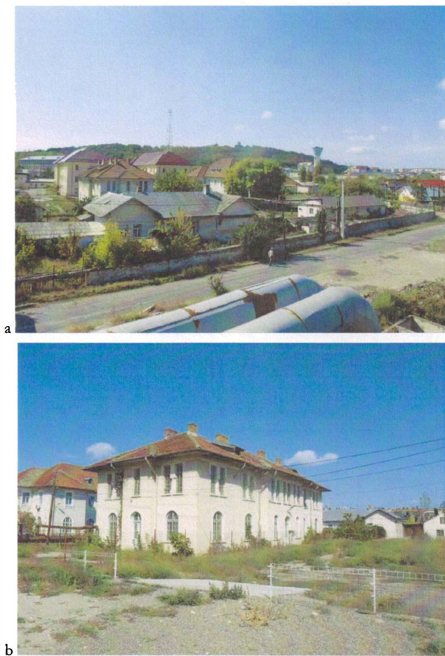
Fig 5. Grup de clădiri aflate la răsărit de mănăstirea Frumoasa și la poalele dealului Cetățuia. Vedere generală (a) și detaliu (b)