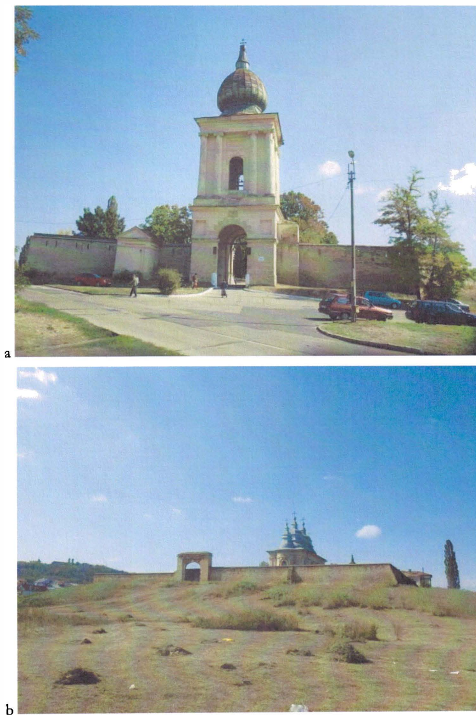
Fig 4. Mănăstirea Frumoasa. Vedere dinspre vest (a) și est (b)