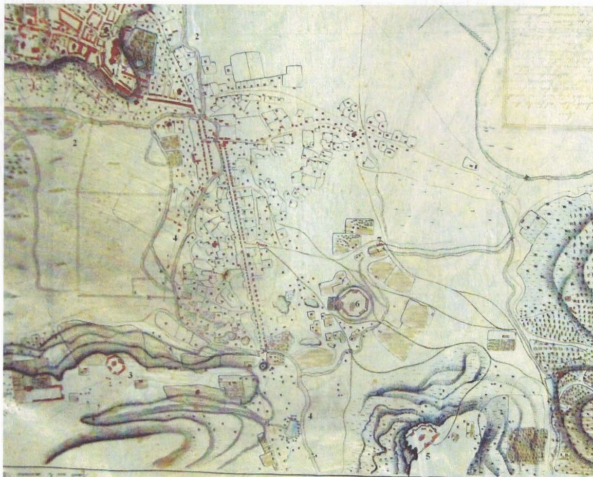
Fig. 2. Zona de sud a orașului Iași la începutul secolului al XIX-lea.

Prelucrare după planul orașului întocmit de inginerul Joseph de Bajardi, în anul 1819: