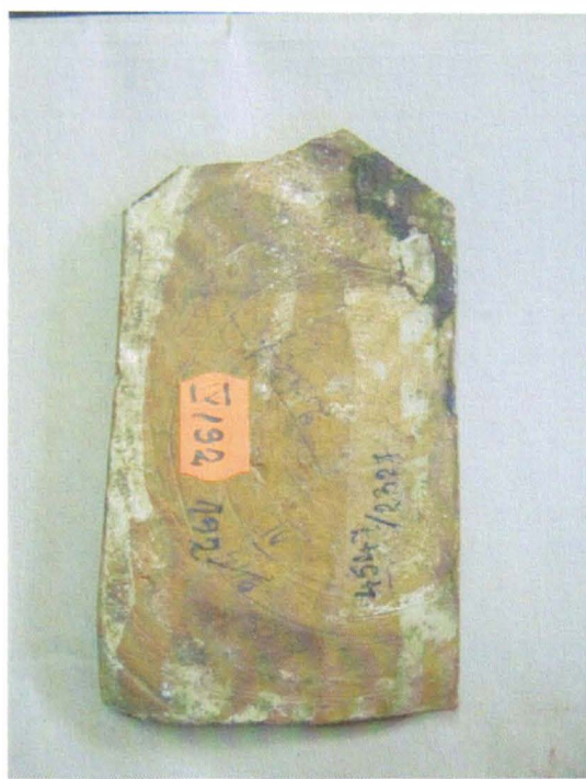
Fig. 2. Pomelnicul de la biserica din Rediu