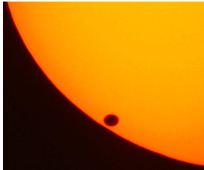
Fig. 1. Tranzitul lui Venus din 8 iunie 2004.