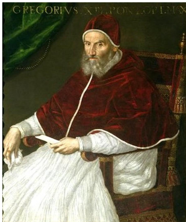
Imaginea nr. 2 Grigore al XIII-lea

Înainte de adoptarea sa, planul lui Lilio a fost distribuit celor mai renumite universități din Europa pentru a fi revizuit. Totuși, tratatul original, aflat încă în manuscris în momentul morții sale, nu a fost transmis. Ceea ce circula era doar o scurtă schiță sinoptică, întocmită de unul din membrii comisiei, matematicianul spaniol Pedro Chacon 10 . Evident, papa era nerăbdător să finalizeze reforma și nu dorea să-și piardă vremea cu tipărirea manuscrisului lui Lilio. Pentru el era suficient să fie cunoscute doar principalele puncte, lăsând deoparte orice explicație. Se pare că manuscrisul nu a fost tipărit niciodată și, din nefericire, a fost ori pierdut, ori distrus. Documentul cel mai apropiat de tratatul său era " Compendium novae rationis restituendi kalendarium ". Este considerat, de fapt pierdut doar originalul tratatului și timp de secole s-a crezut că nu va mai fi găsit niciodată. S-au găsit, totuși, câteva copii în arhivele italiene. Lucrarea a fost multiplicată la Roma în 1577, de cei care au publicat și "Prințul" lui Machiavelli.