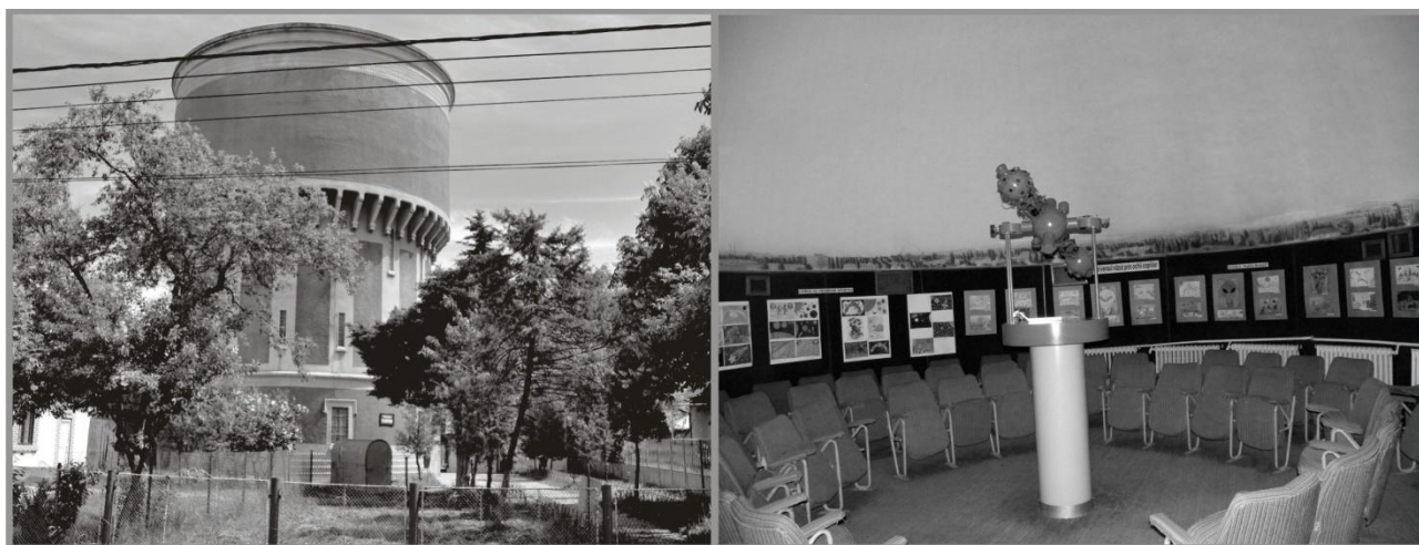
Imaginea nr.2 Observatorul Astronomic Bacău. Mutarea în vechiul turn de apă

Pe 4 mai 1984 se deschide noul sediu al Observatorului Astronomic băcăuan, inaugurându-se Planetariul și expoziția permanentă de astronomie, aceasta fiind și cea mai mare expoziție de astronomie din țară. Cupola planetariului avea o capacitate de 80 de locuri dispuse circular, în centrul acesteia fiind montat proiectorul de planetariu de tip ZKP2 al firmei Zeiss. În cadrul Planetariului din Bacău puteau fi vizionate următoarele spectacole de planetariu: „Constelațiile”, „Mișcările Pământului”, „Mișcările planetelor” și „Coordonate cerești”.