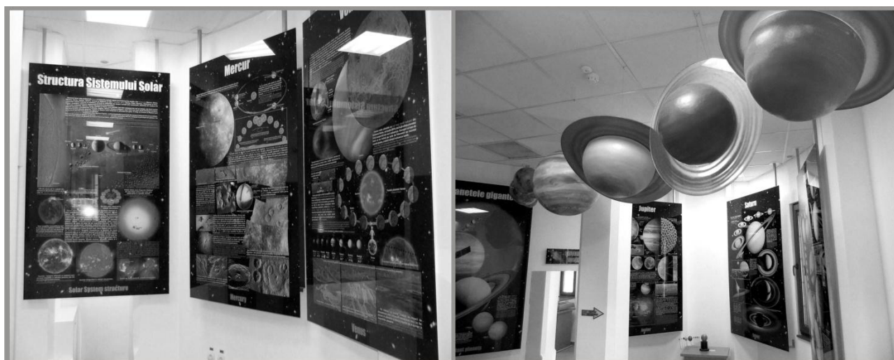
Imaginea nr.6 Expoziția permanentă vernisată pe 31 mai 2016

Tot în cadrul proiectului de modernizare a fost vernisată o nouă expoziție permanentă, numită „Universul - de la Pământ la stele”, precum și expoziția temporară „Astropoezie”. Expoziția permanentă cuprinde teme precum „Sistemul Solar”, „Astronautica”, „Gruparea stelelor”, „Evoluția stelară” și „Formarea și evoluția Universului”, panourile expoziției fiind completate de aparatură și diverse machete tridimensionale, tot ansamblul prezentând într-o manieră explicită cele mai recente descoperiri din domeniul astronomiei și astronauticii.