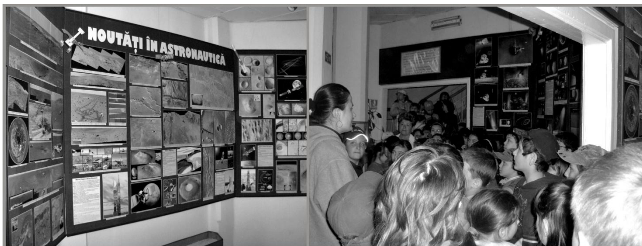
Imaginea nr. 4 Expoziția temporară "Noutăți în astronautică" (2006)

Expoziția permanentă a fost, ulterior, completată de expoziții temporare și itinerante deschise la sediul Observatorului Astronomic sau la cel al colaboratorilor (în principal, școli din județ). Din multitudinea de proiecte expoziționale realizate de-a lungul anilor, amintim expozițiile temporare: „Noutăți în astronautică”, „Stația Spațială Internațională”, „Omul pe Lună”, „Galaxiile” etc.