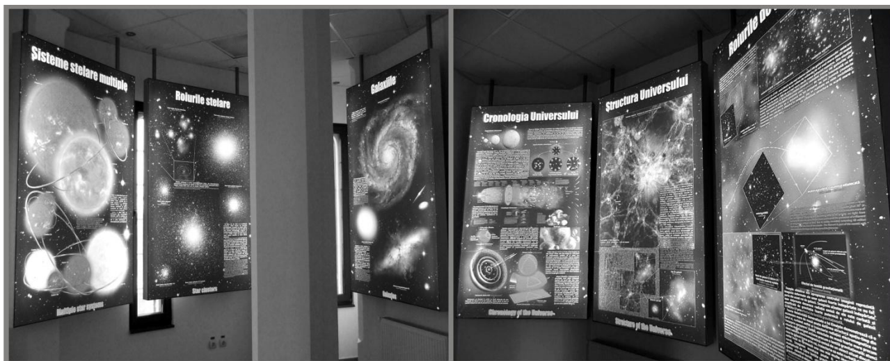
Imaginea nr. 7 Expoziția permanentă vernisată pe 31 mai 2016

Acest proiect european de succes a reușit să renoveze și să conserve vechiul turn de apă al orașului, clădire declarată monument istoric, și să creeze, în același timp, o instituție modernă de promovare a astronomiei și un obiectiv turistic atractiv.