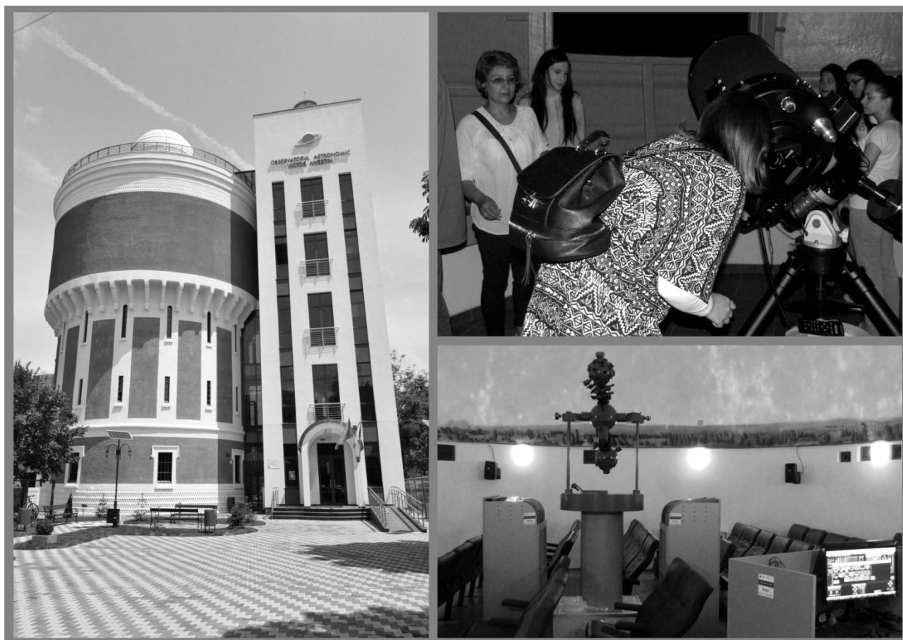
Imaginea nr. 5 Observatorul Astronomic "Victor Anestin" - mai 2016

Tot în cadrul proiectului de modernizare a fost vernisată o nouă expoziție permanentă, numită „Universul - de la Pământ la stele”, precum și expoziția temporară „Astropoezie”. Expoziția permanentă cuprinde teme precum „Sistemul Solar”, „Astronautica”, „Gruparea stelelor”, „Evoluția stelară” și „Formarea și evoluția Universului”, panourile expoziției fiind completate de aparatură și diverse machete tridimensionale, tot ansamblul prezentând într-o manieră explicită cele mai recente descoperiri din domeniul astronomiei și astronauticii.