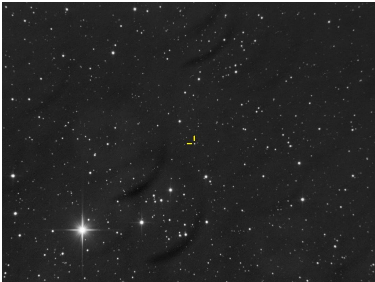
Imaginea nr.1 – Steaua Schela V1

Fotometria s-a realizat în Diffraction Limited MaximDL V5.24. În cadrul fotometriei am folosit magnitudinile în filtru Johnson V pentru stelele de comparație din catalogul APASS (AAVSO Photometric All-Sky Survey).