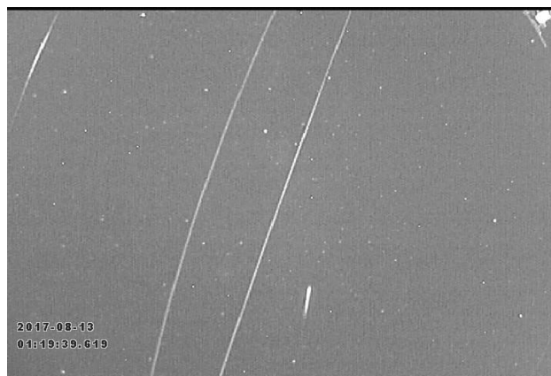
Imaginile nr. 4 și nr. 5 Cadre capturate cu meteori ce aparțin curentului Perseide 12-13 august 2017