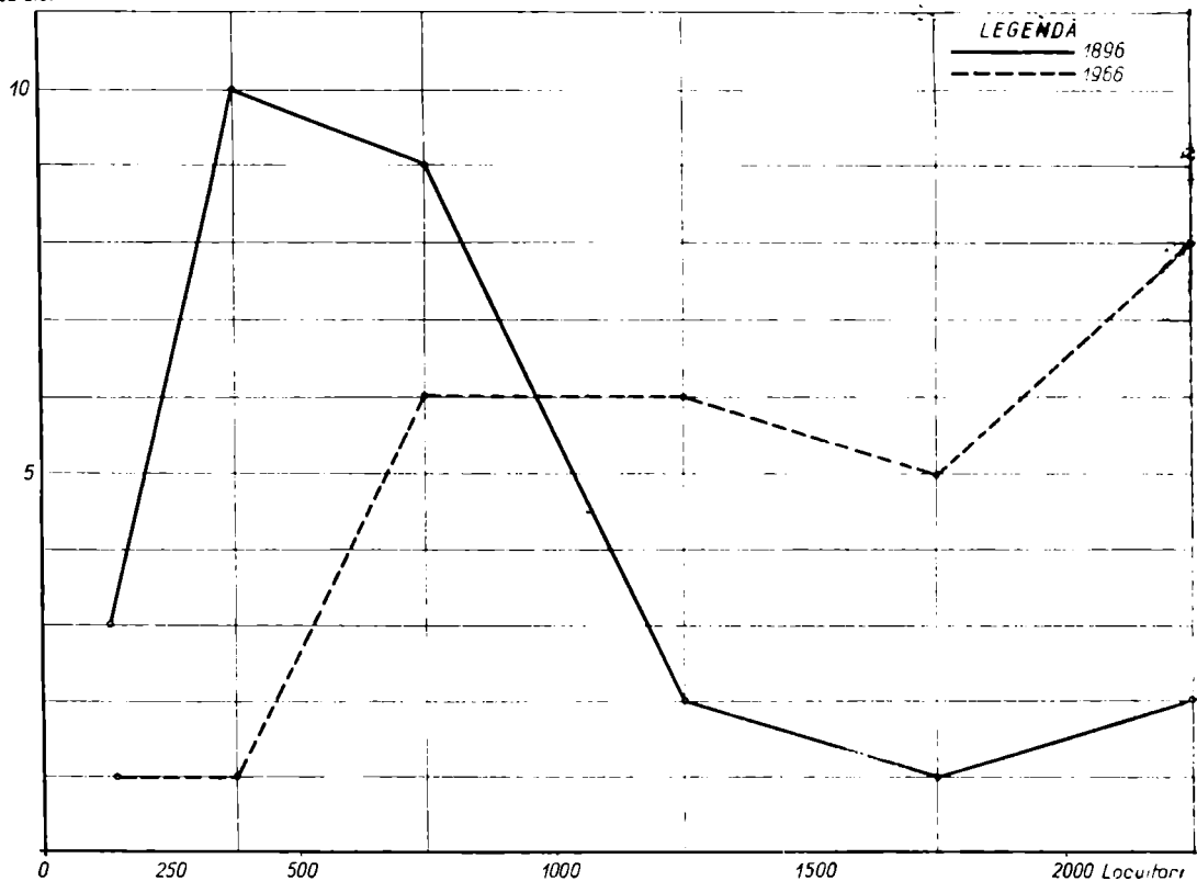
Fig. 2. Graficul evoluției mărimii satelor din orizontul complexului Razelm între anii 1896—1966.

Dintre dezavantajele mai puternice mineralizării a lacurilor sudice, acela de influențare negativă a apei din puțuri a fost hotărâtor pentru retragerea satelor mai spre interiorul câmpiei.