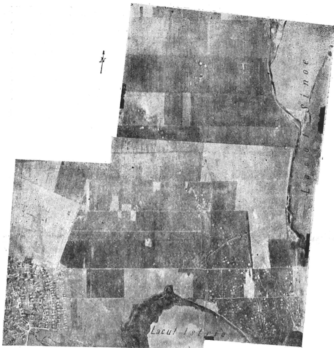
Pl. 2 Mozaic aerofotografic al necropolei tumulare a Histriei, cu zonele învecinate.