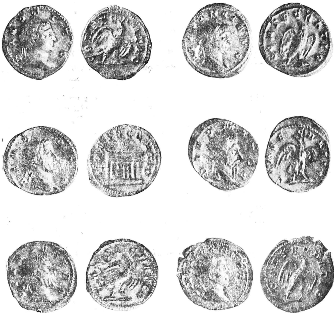
Fig. 2. Isaccea. Antoniniani romani emiși către mijlocul sec. III e.n.

de emitere a acestui tip monetar. Descoperirile de pînă acum ne dau indicații doar asupra perioadei lor de batere. De exemplu, în tezaurele descoperite pînă acum în țara noastră, care se încheie cu monede de la Filip Arabul, nu se întîlnește nici o astfel de piesă, ceea ce indică un terminus post quem pentru data emiterii lor. Într-un depozit de