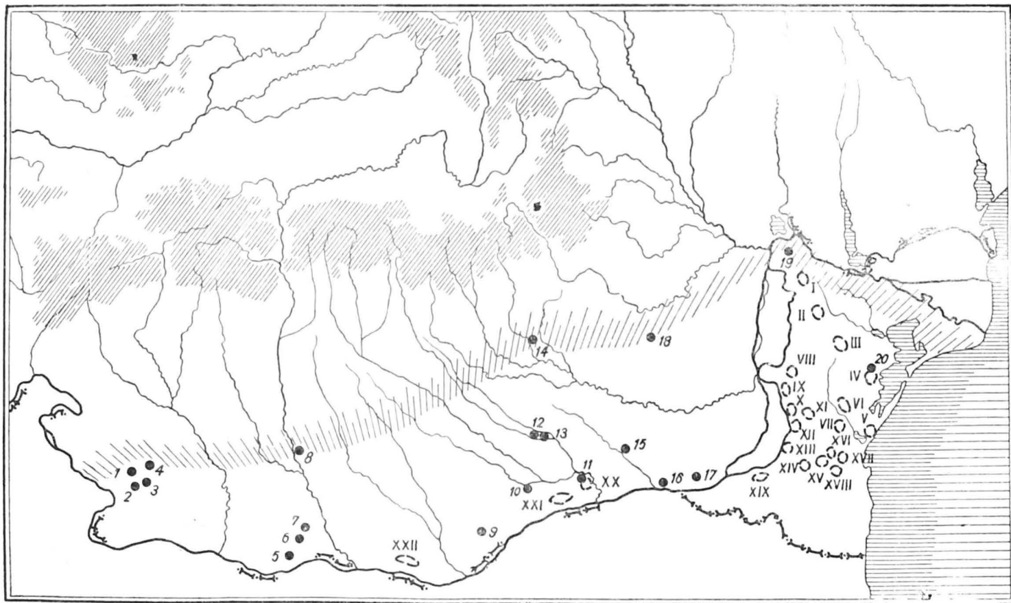
Fig. 1 Harta de răspîndire a pieselor de silex de tip „balkanic“, din cursul neoliticului timpuriu (zonele marcate cu cifre latine reprezintă zăcămintele).