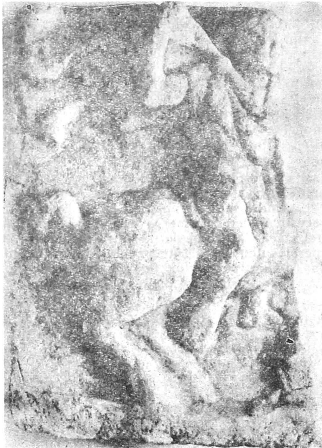
Fig. 2 — Le Cavalier thrace chassant Fig. 2 — Cavalerul Trac — la vînătoare

Cea de a doua placă votivă are numărul de inventar 479 și provine din satul Iazurile, comuna Valea Nucarilor. (Fig. 2). Dimensiunile ei