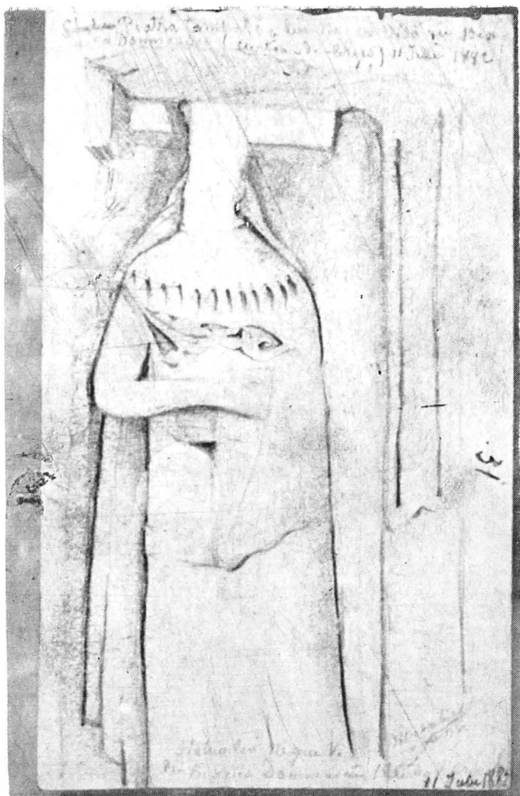
Fig. 4. Vestigii medievale minuțios corectate de arheologul Butculescu.