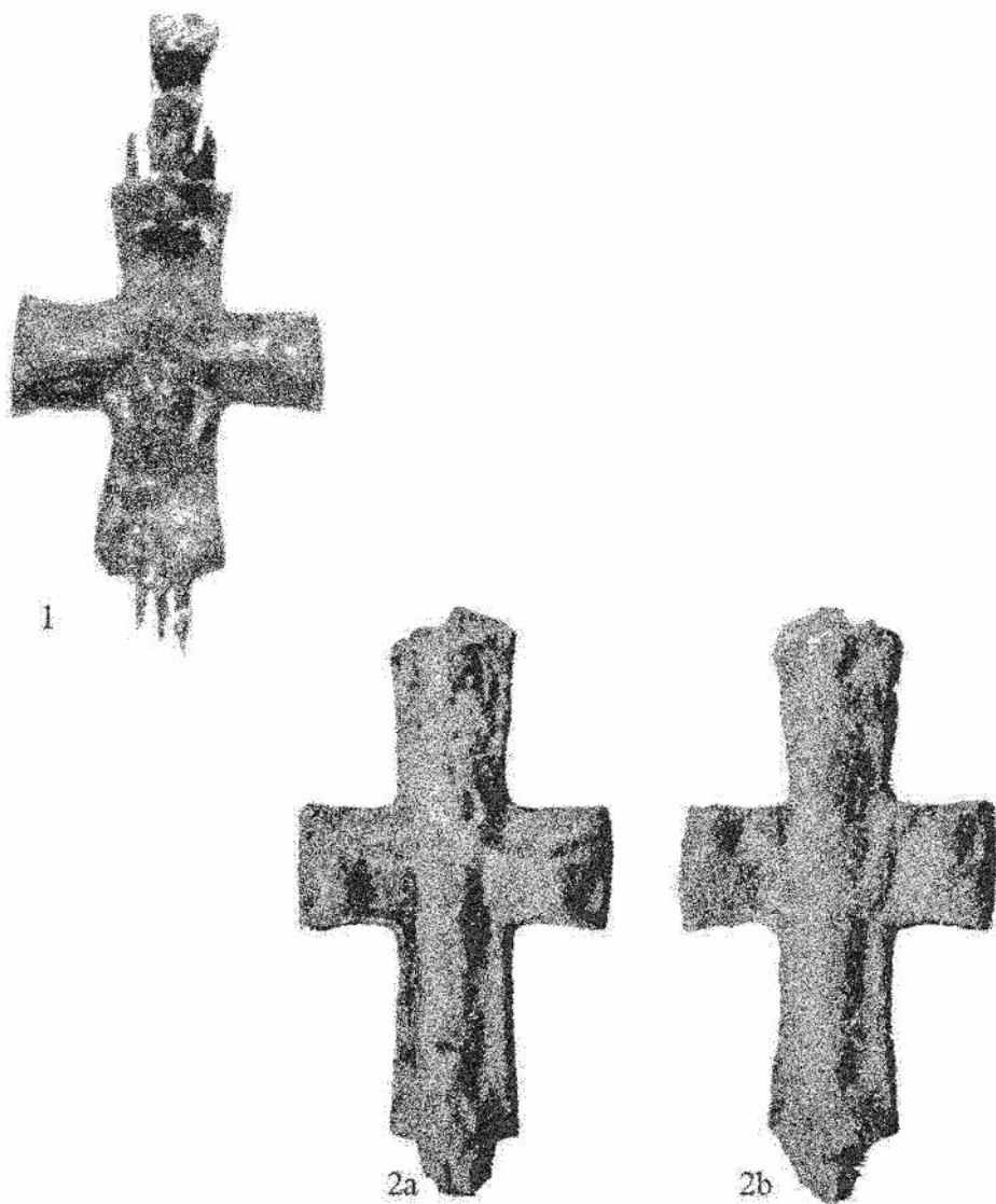
Pl. II. Cruci relicvar cu figuri în relief . Pl. II. Croix-reliquaire avec figures en relief .