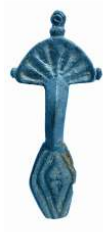
Fig. 8. Fibula gota da Osoppo (UD).