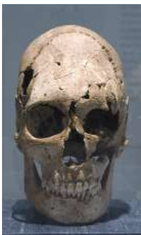
Fig. 10. Cranio deformato dalla tomba 15 da Globasnitz.