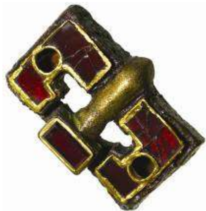
Fig. 4. Fibbia da Dravlje, tomba 19.