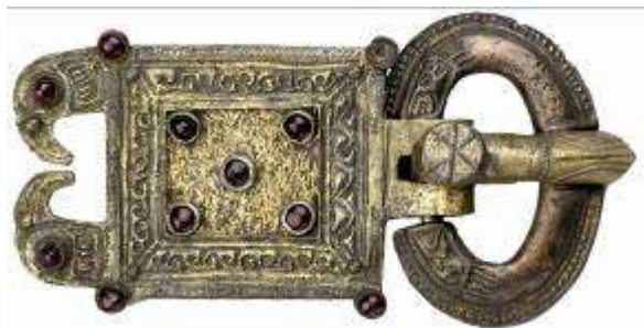
Fig. 5. Fibula da Kranj (Slovenia).