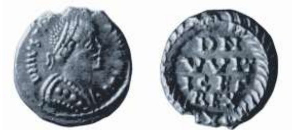
Fig. 9. Moneta dei Goti da S. Giorgio di Attimis.