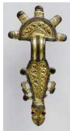
Fig. 11. Fibula gota da Planis (UD).