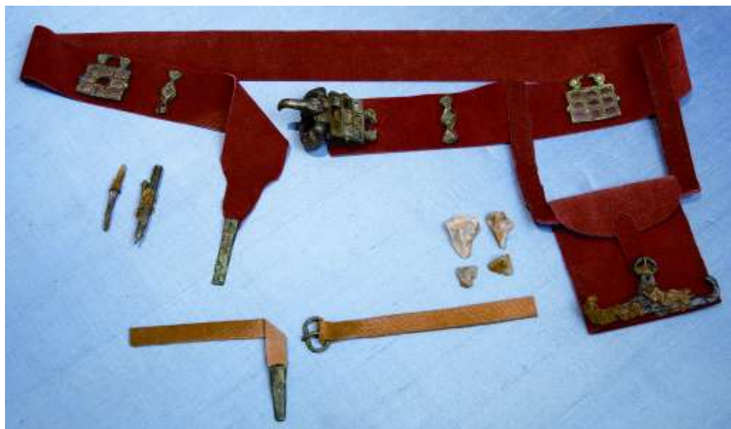
Fig. 6. Elementi di cingulum dalla tomba n. 11, di un ufficiale dei Goti, rinvenuta nel 1999 a Globasnitz.