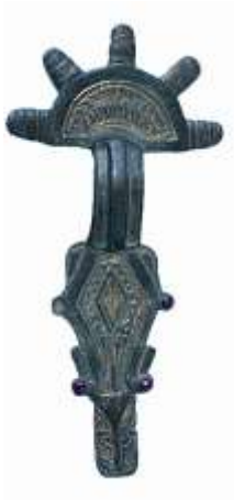
Fig. 7. Fibula gota da Aquileia.