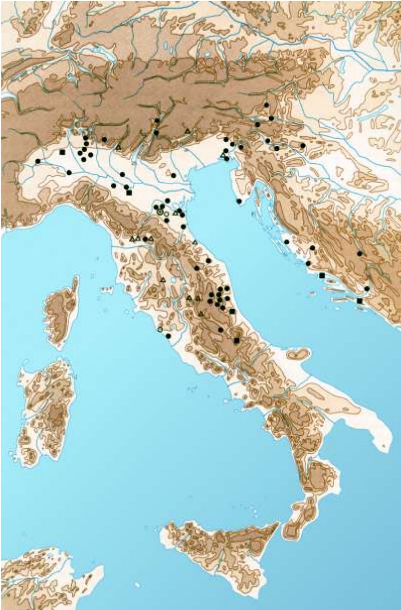
Fig. 1. Distribuzione dei ritrovamenti goti in Italia, Slovenia, Austria e Croazia (da Villa 2008). Come si vede l'Italia nordorientale, la Carinzia (Austria) e la Slovenia mostrano presenze alquanto fitte.