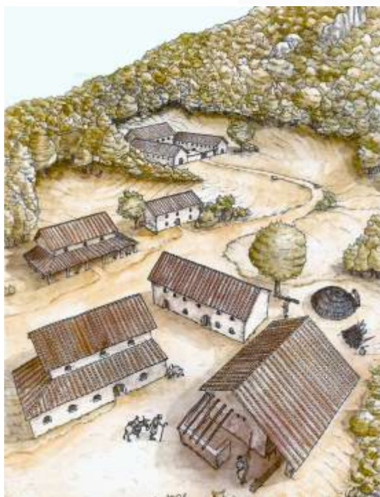
Fig. 3. Ricostruzione ideale dell'insediamento di Monte Barro.