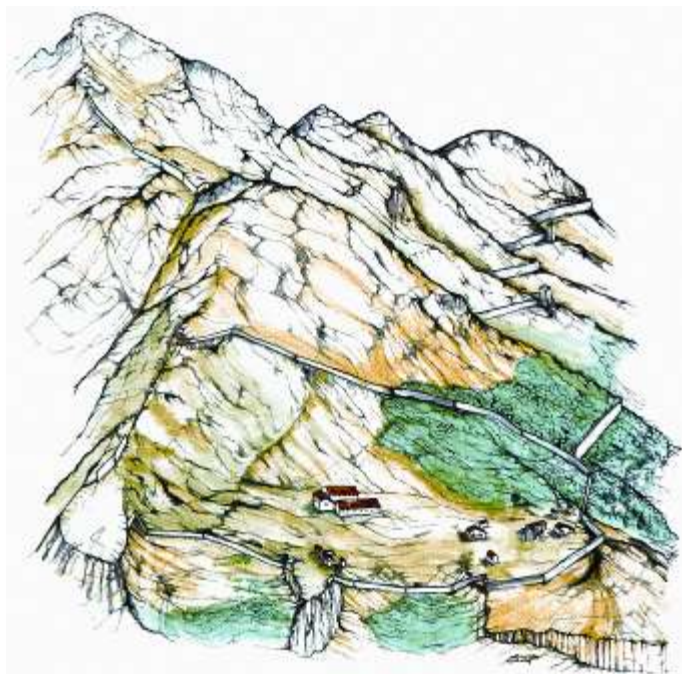
Fig. 2. Il sito di Monte Barro (da Archeologia a Monte Barro 2001).