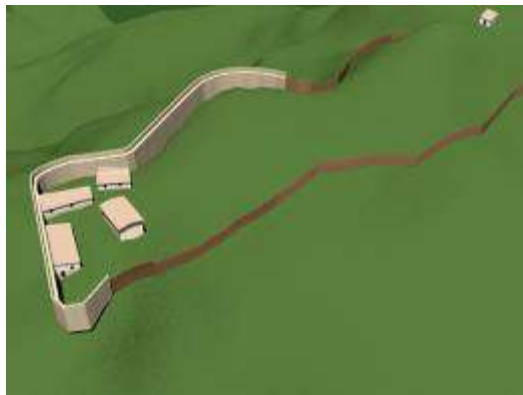
Fig. 14. Ricostruzione della parte scavata dell'insediamento di S. Giorgio di Attimis.