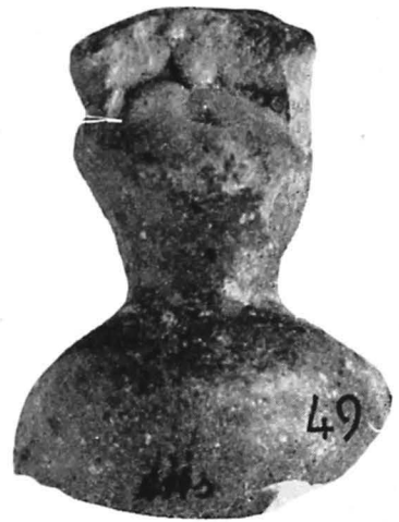
PL. V — FIGURĂ ANTROPOMORFĂ (47—49), VAS CU REPREZENTĂRI ANTROPOMORFE-KÖLN (50), FRAGMENT DE STEATIT FIGURAT (46).

PL. V — FIGURE HUMAINE EN CÉRAMIQUE (47—49), VASE À REPRÉSENTATIONS HUMAINES — KÖLN (50), PIÈCE DE STÉATITE FIGURÉE (46).