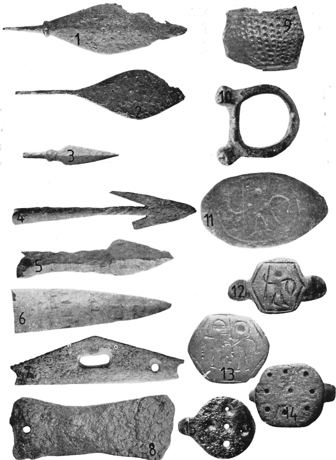
PL. I — ARME: VÎRFURI DE SĂGETI (1—6), PIEȘĂ TOLBĂ DE SĂGETI (7); UNELTE: TESLĂ-SĂPĂLIGĂ (8), DEGETAR (9); ACCESORII VESTIMENTARE ȘI PODOABE: CATARAMĂ (10), INELE (11—15)

PL. I — ARMES: FLÈCHES (1—6); PIÈCE DE CARQUOIS (7); OUTILS: AISETTE-SER-FOUETTE (8), DÉ (9); BOUCLE DE CEINTURE (10); BAGUES (11—15).