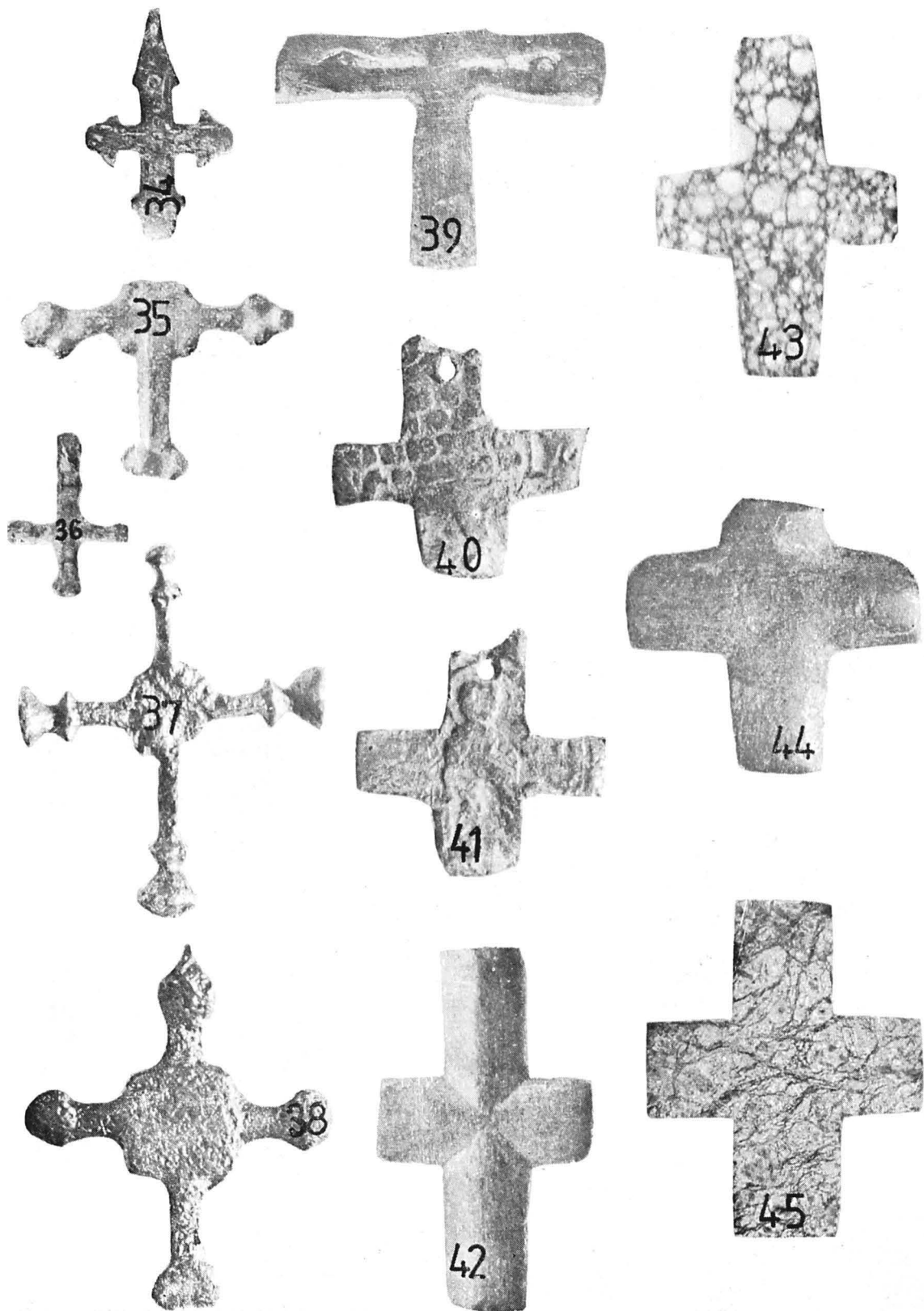
PL. IV — CRUCIULIȚE METALICE (34—39), DE LEMN (44), DE PIATRĂ (42), MARMURĂ (43, 45) ȘI SIGILIU DE PLUMB (40—41).

PL. IV — CROIX MÉTALLIQUES (34—39), DE BOIS (44), DE PIERRE (42), DE MARBRE (43, 45) ET SCEAU DE PLOMB (40—41).