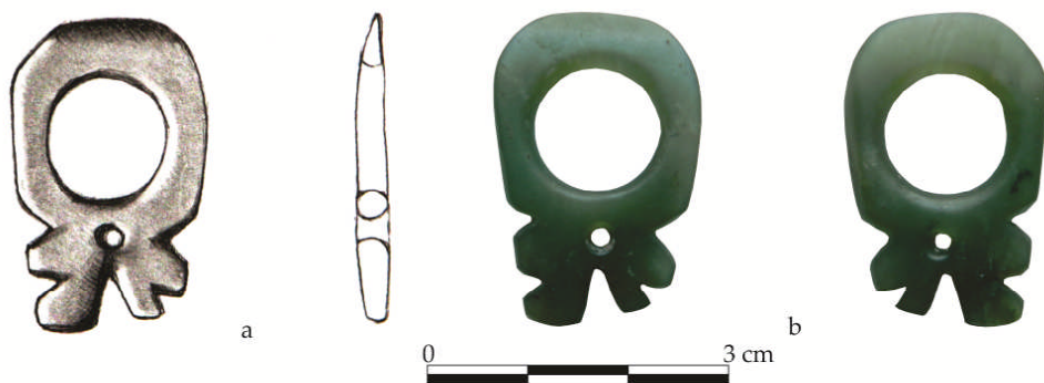
Fig. 3. Pandantivul de nefrit / The nephrite pendant (desen / drawing by C. Georgescu).

Nefritul este un mineral din seria clino-amfibolelor, de obicei de culoare verde deschis sau închis, dar poate fi și alb, gălbui, roșu-marونی sau chiar negru. În unele cazuri poate conține mici intruziuni negre, atribuite de obicei magnetitelor 9 .