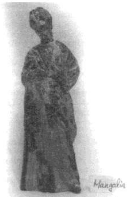
Faze ale procesului de restaurare STATUETA "TANAGRA"