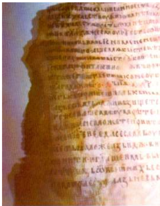
În momentul descoperirii