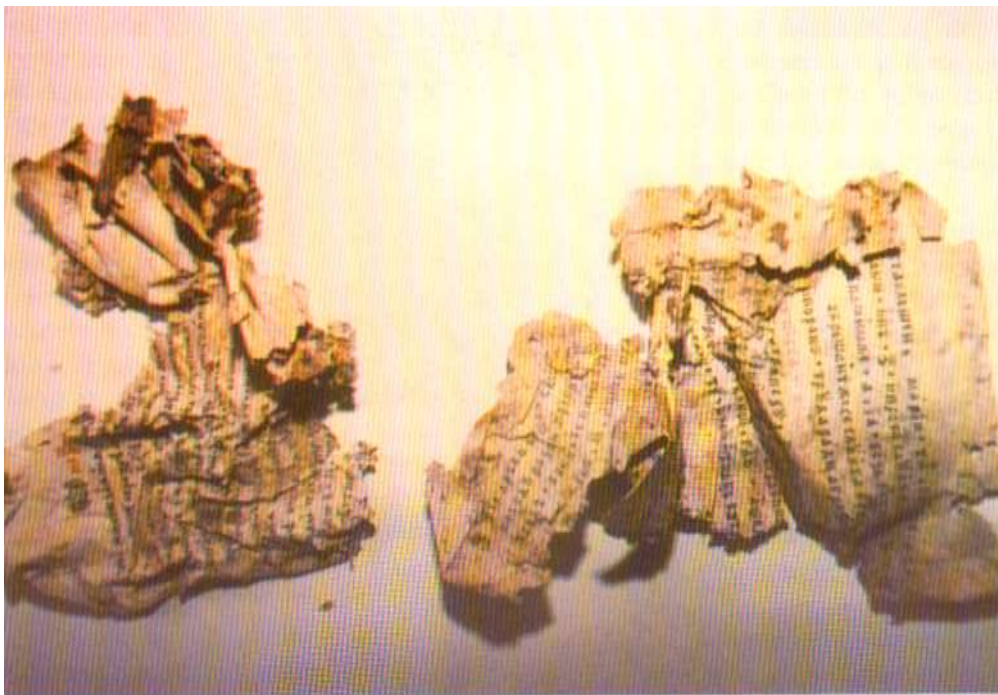
În momentul descoperirii