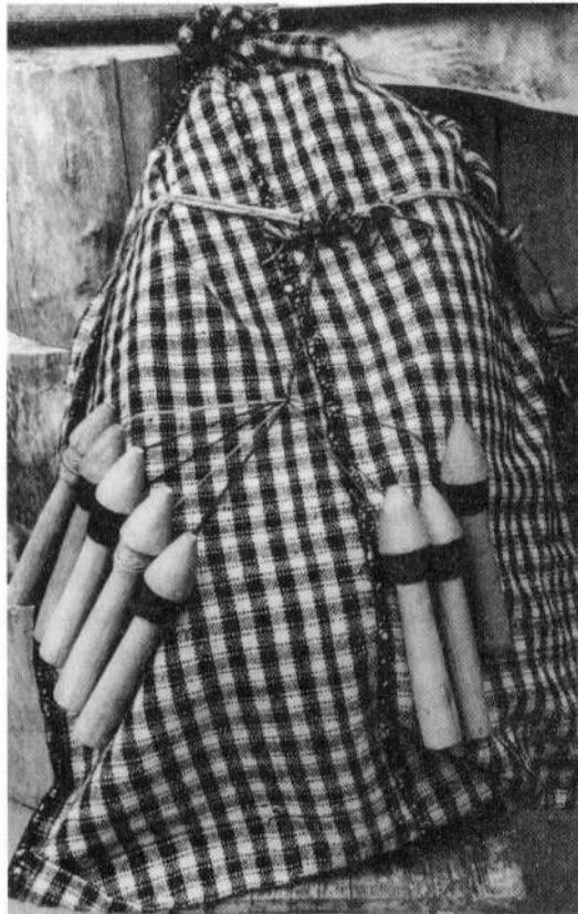
Foto 5 - ansamblul tehnic pentru realizarea găitanelor (cópâne cu ciócane)