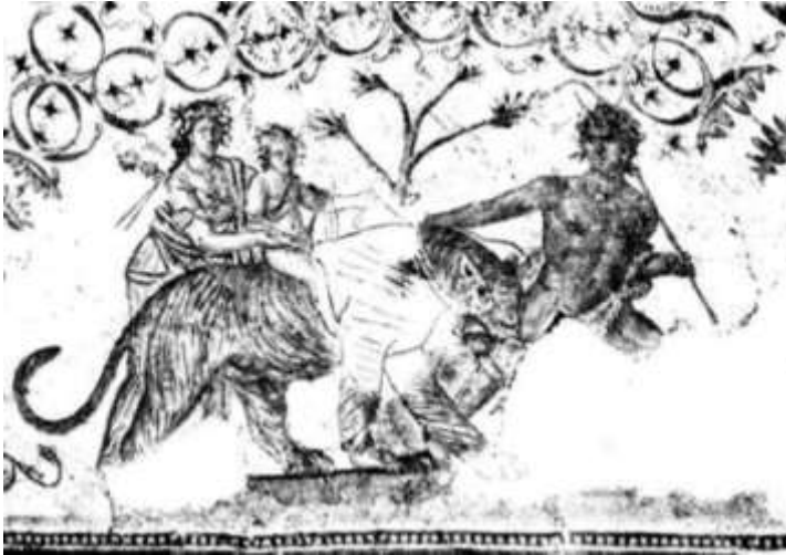
Fig. 7. Dionysos copil, călare pe panteră, cu nimfă și satir, detaliu din mozaicul din Djemila (Algeria) / Child Dionysus riding a panther, with nymph and satyr, detail in the mosaic of Djemila (Algeria) (Blanchard 1980, 170, fig. 1).

Nysa. Vârsta personajului sculptat pe monumentul de la Tulcea este comparabilă cu aceea a copilului Dionysos călare pe panteră de pe mozaicul din Djemila (Fig. 7) și/sau cu aceea a lui Dionysos cu ciorchinele de strugure, aflat în spinarea satyrului, în Villa Albani din Roma (Fig. 11/2).