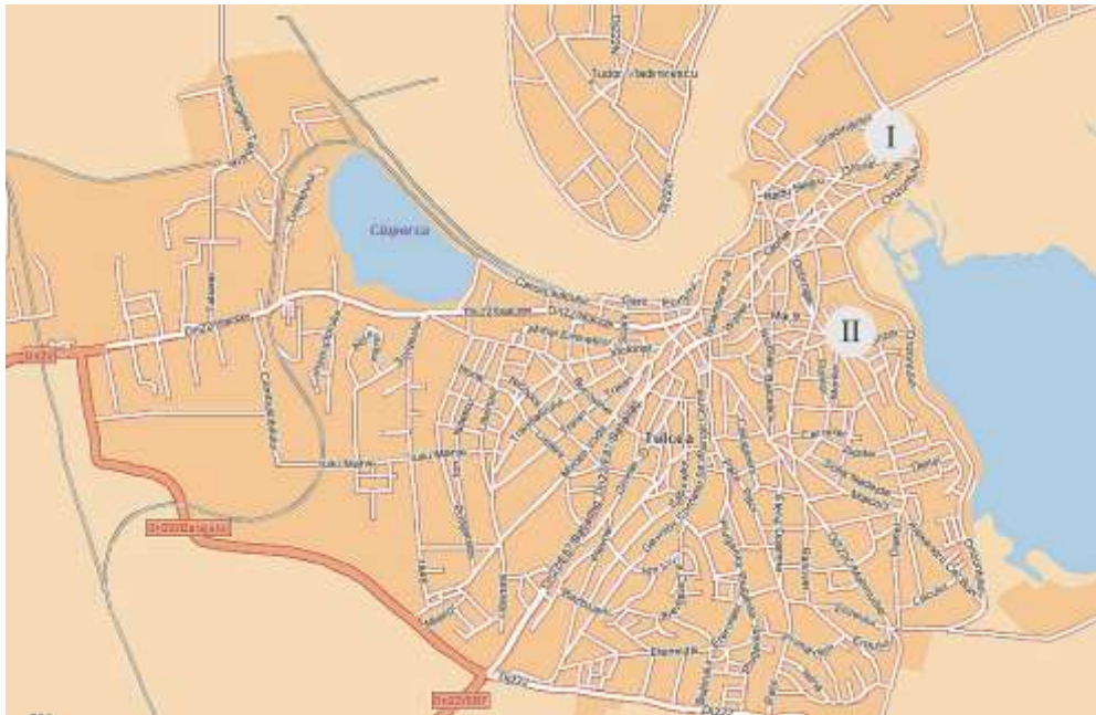
Fig. 1. Planul orașului Tulcea cu locul descoperirii reliefului dionisiac (II), la cca. 1 km SE de cetatea Aegyssus (I) / Layout of Tulcea with the place of discovery of the Dionysian bas-relief (II), approx. 1 km SE of Aegyssus settlement (I).

Fragmentul de relief votiv a păstrat o mare parte din imaginea copilului Dionysos , sculptată în nișă, în basorelief, încadrată de chenare late și fronton triunghiular 2 , sugerând fațada unui templu, sau mai degrabă a unui monument funerar.