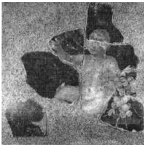
Fig. 10. Pictură murală din villa rustica de la Baláca (Pannonia), detaliu cu Dionysos copil / Mural in rustic villa Baláca (Pannonia), detail with child Dionysos (Kirchhof 2002).

Anumite apropieri stilistice cu piesa de la Tulcea întâlnim în Dobrogea sec. al II-lea p.Chr., pe placa votivă de la Mangalia, pe care am amintit-o mai sus, și pe altarul bacchic de la Urluia, în special, în privința coafurii personajului divin, cu precizarea că, în cel de-al doilea caz, de șuvițele de păr care cad pe umeri zeului sunt atârnați doi ciorchini de struguri. Micul și originalul altar bacchic din calcar de la Urluia ne atrage atenția prin atitudinea relaxată a personajului adolescentin, diferită de aceea a lui Dionysos din reliefurile votive de la Tulcea, dar realizată în aceeași manieră stilistică. Realizarea unor opere artistice în aceeași manieră stilistică originală evidențiază fenomenul constituirii unei arte sculpturale specifice provinciei romane de la Dunărea de Jos.