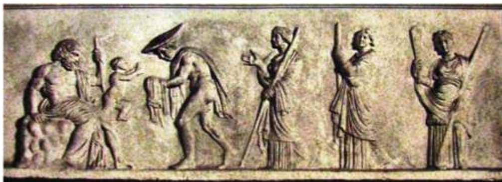
Fig. 4. Nașterea lui Dionysos din coapsa lui Zeus. Basorelief antic, din epoca clasică (Muzeul Vatican) / Birth of Dionysus from the thigh of Zeus. Ancient bas-relief, classic age (Vatican Museum) ( www.cosmovation.com Dionysos: les mythes ).

În fosta provincie romană de la Dunărea de Jos, cele mai frecvente simboluri dionysiace – vița-de-vie și craterul – se întâlnesc, în special, pe monumentele funerare. Iconografia dionysiacă votivă, din aceste locuri, nu foarte bogată, dar foarte expresivă, este reprezentativă pentru imaginea unui zeu al fertilității, al vegetației și al vinului 32 . Demne de menționat sunt reprezentările de scene bachice de pe amforetele de la Greci (jud. Tulcea), din sec. I p.Chr. 33 , asemănătoare celor de pe oenochoe -le din Dacia, de la Tăuteu și Apahida 34 , din sec. al II-lea p.Chr., sau