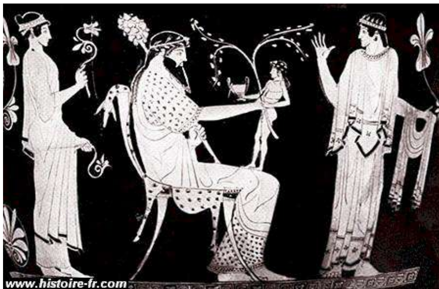
Fig. 5. Dionysos renăscut, pictură roșie pe fond negru, ceramică attică, sec. al V-lea a.Chr. (Muzeul Luvru) / Dionysus reborn, red on black painting, Attic ceramic, 5 th c. BC (Louvre Museum) (www.histoire-fr.com: Les Dieux grecs – files. Mythologie grecque. I. La Genèse, II, Les Olympiens, no. 13 ).

frumoasele și interesantele reliefuri votive de la Făgărașu Nou (jud. Tulcea), din sec. II-III p.Chr. 35 Reliefurile votive mici și mijlocii și aediculae -le, în care figura centrală a compoziției este cea a divinității, sunt cele mai răspândite monumente dionysiace de pe teritoriul Dobrogei 36 . Aceștia li se adaugă teracotele 37 , hermele și efigiile cu caracter decorativ-simbolic 38 . Măștile greco-romane, reduse ca număr, aparțin în totalitate tradiției bacchice, fiind reprezentări ale lui Dionysos-Bacchus, tânăr și matur 39 , dar niciodată copil.