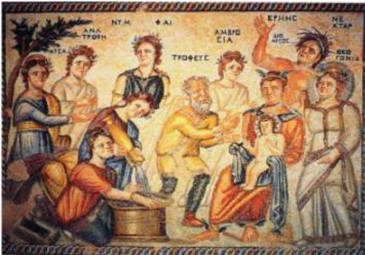
Fig. 8. Îmbăierea copilului Dionysos (Nea Paphos, Cipru SV, Casa lui Aion, detaliu mozaic) / Bathing of child Dionysus (Nea Paphos, Cyprus SW, House of Aion, mosaic detail) (Welch 1998, 360, fig. 138; http://romeartlover.tripod.com/Paphos2.html ).