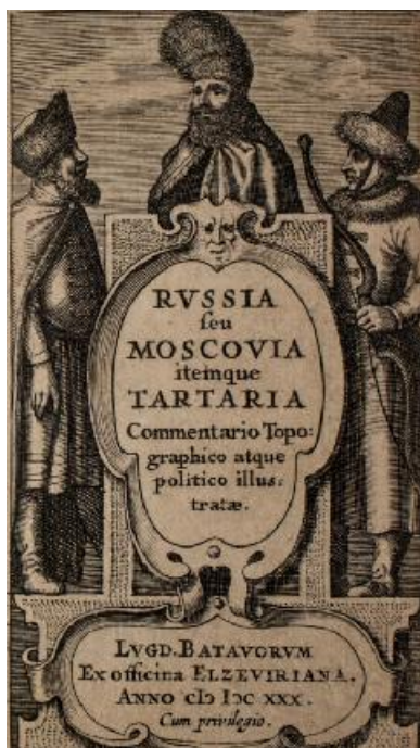
Fig. 2. Russia seu Moscovia itemque Tartaria , Lugd. Batavorum, 1630 – Foaia de titlu cu gravură / Title page with engraving.

Cartea este de format mic, în -16° (11 × 5.5 cm), iar oglinda paginii măsoară doar 9,5 × 4 cm, cu 31 de rânduri pe pagină. Face parte din colecția „Micilor republici” lansată de Casa Elsevier, nu are marcă tipografică, însă în gravura nesemnăată care încadrează titlul lucrării, în registrul superior la mijloc, recunoaștem portretul lui Mihai Viteazul, ca o confirmare a faimei de care s-a bucurat în epocă marele voievod (Fig. 2). Ca și alte titluri ale acestei serii, autorul cărții este necunoscut. Totuși, lucrarea a fost atribuită unor specialiști din sec. al XVII-lea și anume filologului olandez Marcus Zuerius van Boxhorn (1612-1653), profesor la Universitatea din Leiden, care a studiat limbile indo-europene precum și topografului Martin Broniovski.