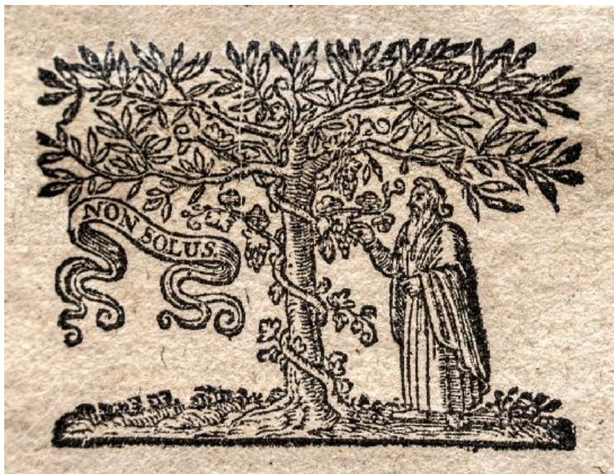
Fig. 1. Emblema Casei Tipografice Elsevier / Elsevier Printing House's Emblem.

Inspirați și inteligenți, Elsevierii au editat și au tipărit lucrări variate din punct de vedere al conținutului: filologie, clasicii latini, istorie, filozofie, medicină, matematică, dicționare etc. Din anul 1629 a început editarea seriei operelor clasicilor latini: Horațiu, Ovidius, apoi Caesar, Plinius și Terentius (Leyden, 1635), Vergilius (Leyden, 1636), Cicero în 10 volume (Leyden, 1642), Titus Livius (Lugd. Batavorum, 1653-1654). În general, edițiile de clasici nu sunt adnotate sau, dacă conțin totuși note, acestea sunt plasate la sfârșitul lucrării ori în subsolul paginilor, pe două coloane 12 . Dintre alte titluri imprimate la Casa din Leiden amintim: Ioannes Meursius, Criticus Arnobianus ... item Hypocriticus Minutianus , Lugduni Batavorum: Ex officina Ludovici Elzevirii, 1598, fără marcă tipografică; Daniel Heinsius, Poematum ... de contemptu mortis , Lugduni Batavorum, 1621; Johannes Gherhardus, Exercitationum pietatis , Lugduni Batavorum, 1630. Acestea din urmă se păstrează în colecțiile Bibliotecii Județene Satu Mare 13 .