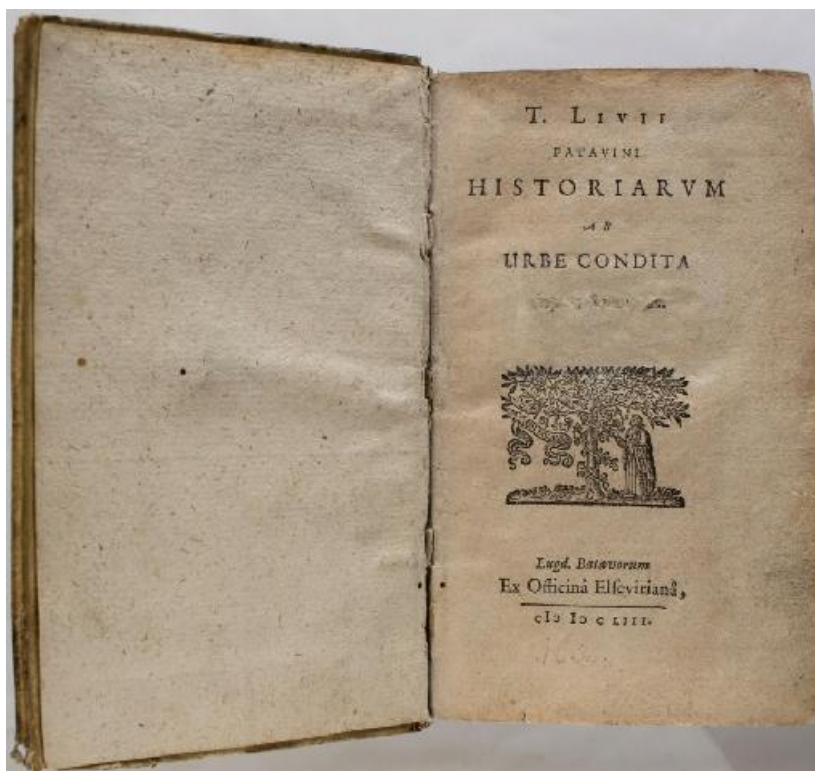
Fig. 5. Livius, Titus, Historiarum Ab Urbe Condita , Tomus secundus, Lugd. Batavorum, 1653 – Foaia de titlu / Title page.

Legătura cărții este din velin, respectiv din piele de vițel nou-născut, adică un pergament fin (Fig. 4), iar starea de conservare este bună. Foarte puține exemplare din această ediție se păstrează în colecțiile altor instituții și biblioteci din țară precum Muzeul Județean de Istorie din Suceava și Biblioteca Institutului de Istorie „Nicolae Iorga” din București (două exemplare) 24 .