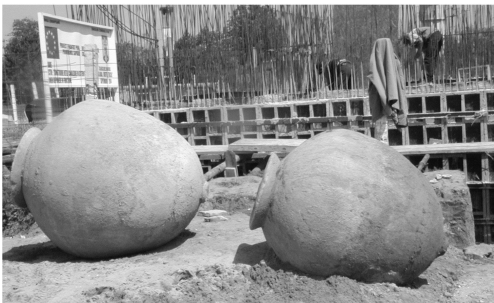
Pl. III. 1- Dolium nr. 3; 2 - dolia nr. 2 și 3. Pl. III. 1- Dolium no 3; 2 - dolia no 2 and 3.