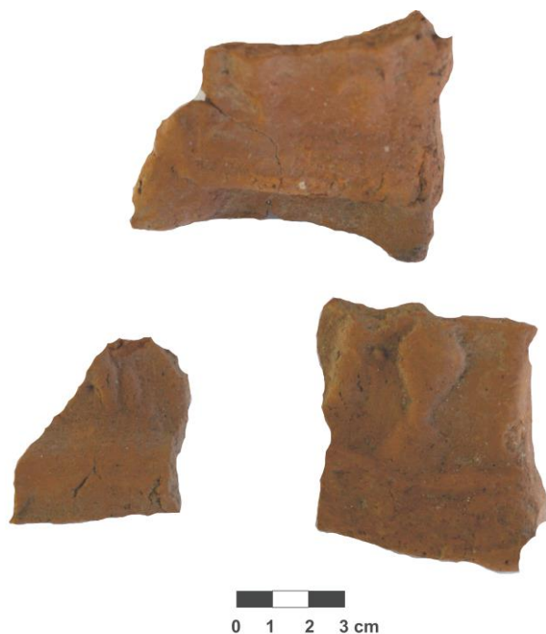
Fig. 3. Fragmentele altarului ceramic descoperit împreună cu statueta / Fragments of the ceramic altar discovered together with the statuette.

Statueta 6 are înălțimea de 28 cm și este realizată din lut, modelat în tipar, finisată cu grijă, în partea dorsală prezintă un decupaj circular de evaporare. Având la bază tipul Anadyomene, zeița este reprezentată cu piciorul drept în față, brațul drept ridicat, probabil aranjându-și părul, iar cel stâng coborât, în postura clasică. Bine proporționată, indică idealul frumuseții feminine, aflate la apogeul tinereții sale.