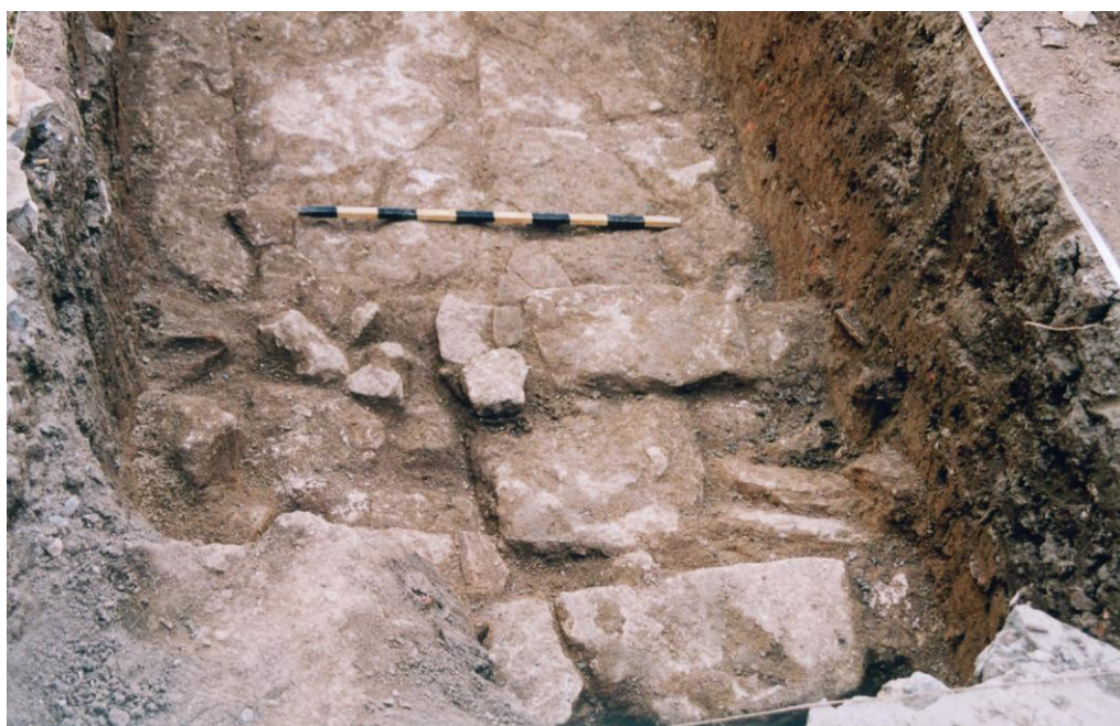
Fig. 1. Fotografia săpăturii – Str. Arcului, nr. 3 B, Mangalia / Photograph of the excavation – 3 B, Arcului Street, Mangalia.

Datorită condițiilor deosebite în care s-a desfășurat cercetarea arheologică, am putut trasa doar o secțiune de 3,20 \times 2 m, orientată N-S. După înlăturarea stratului vegetal și solului brun-închis aflat sub acesta, de la adâncimea de -0,50 m au început să apară diverse fragmente ceramice, litice, cuie din fier și urme de arsură. Secțiunea trasată a scos la lumină colțul unui edificiu format din două ziduri perpendiculare între care se află un pavaj realizat din plăci din calcar. Zidul dinspre nord, cu lățimea de 1 m, este legat cu pământ, cu blocurile de exterior bine fășuite, lucrat cu grijă. Din zid se păstrează doar prima asiză deasupra nivelului pavajului. Celălalt zid a fost surprins doar pe o porțiune de 0,10 m pe latura de est a secțiunii, format tot dintr-o asiză din blocuri de mari dimensiuni. Pavajul este compus din lespezi din piatră de mari dimensiuni, de diferite mărimi și cu forme neregulate, îngrijit îmbinate (Fig. 1).