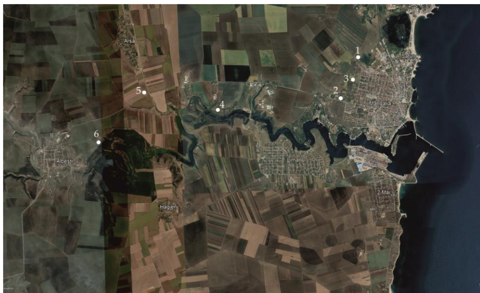
Fig. 1. Punctele din chora callatiană unde au fost descoperite toarte de amfore ștampilate de producție sinopeeană / Discovery sites of Sinopean stamped amphora handles in the chora of Callatis :

În ultimii 10 ani au fost efectuate, de către unul dintre autori, un șir de cercetări arheologice de teren la câteva situri din zonă, în urma cărora a fost colectat un bogat material amforic, printre care și ștampile de amfore grecești 1 . Aceste situri sunt dispuse în zona chorei callatienae, în punctele: La Movile , Castelul de apă , Cartierul din vestul Mangaliei– Coloniști , fosta Fermă piscicolă Limanu, așezarea greco-romană de la Arsa și în zona pădurii Hagieni (Fig. 1).