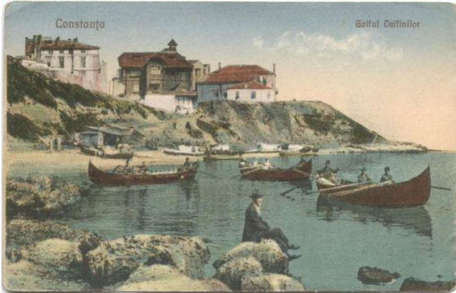
Fig. 1. Golful Delfinilor după anul 1900 / The Dolphin Bay after 1900.

sfârșitul sec. XIX și începutul celui următor, își făceau des apariția numeroase exemplare de mamifere marine.