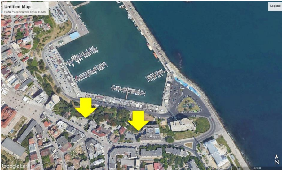
Fig. 4. Vedere din satelit a peninsulei și a actualului port modern Tomis (Google Earth). Sunt marcate zonele scărilor de acces realizate în anii 1958-1959 / The satellite view of the peninsula and the current modern port of Tomis (Google Earth). The areas of the access stairs made in 1958-1959 are marked.

Portul Tomis devine un mic bazin portuar, creat prin închiderea golfului cu două diguri nou construite, cel nordic (în formă de Y, lung de 400 de metri și prelungit în 2007, cu încă 200 de m) și cel estic (lung de 500 m), care făcea legătura cu faleza Cazinouului 13 .