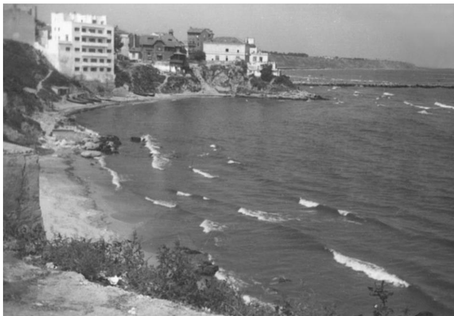
Fig. 3. Golful Delfinilor înainte de anul 1958 / The Dolphin Bay before 1958.

În cea mai lată zonă de nisip din cadrul acestui Golf al Delfinilor, a funcționat timp de 35 de ani, în perioada 1887-1932, Plaja Duduia, prima de acest gen din oraș, în care se făceau, în mod organizat, băi de mare și de soare 4 . Acest fapt a fost posibil după ce Primăria Constanței a vândut la licitație unui antreprenor local, pe data de 27 aprilie 1897, dreptul de amenajare și administrare a spațiului respectiv 5 . Plaja din Golful Delfinilor a devenit și mai populară după Primul Război Mondial, când orașul Constanța a cunoscut o dezvoltare economică fără precedent și a devenit un loc căutat de turiști veniți de pretutindeni 6 . Numărul mare de vilegiaturisti a dus la apariția în Golf a altor două plaje mai mici (Diana și Doamnei), neamenajate corespunzător, și la sud de Plaja Duduia.