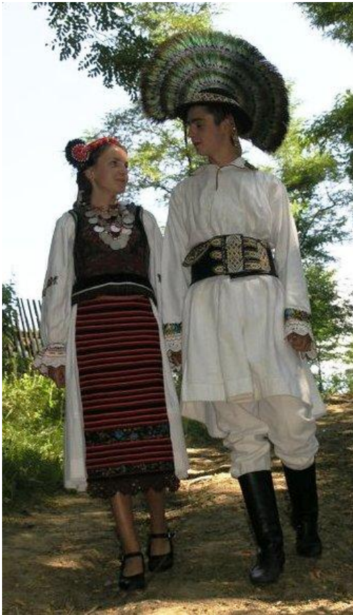
Tineri în port popular din Sângeorz-Băi