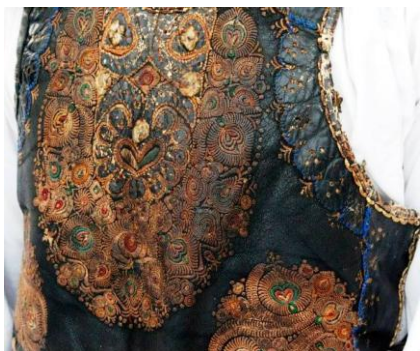
Pieptar negru înfundat

Iarna se poartă cușmă (căciulă) neagră din blană de miel 5 .