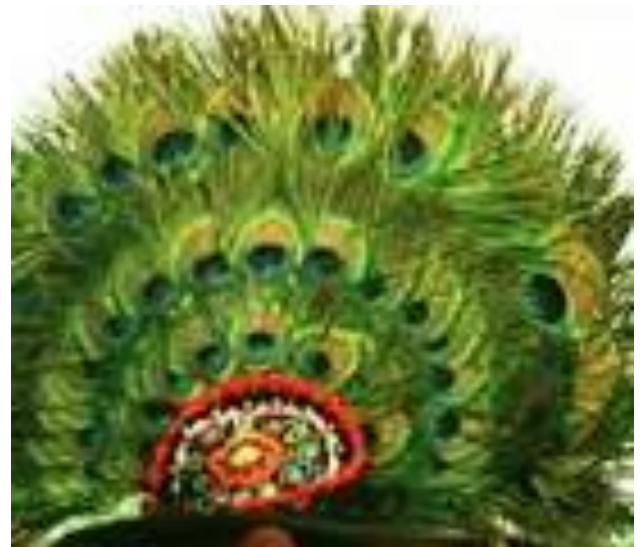
Clop cu păun