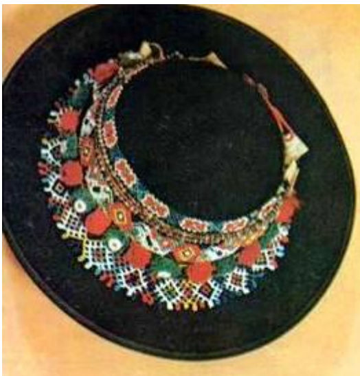
Clop cu gerdan