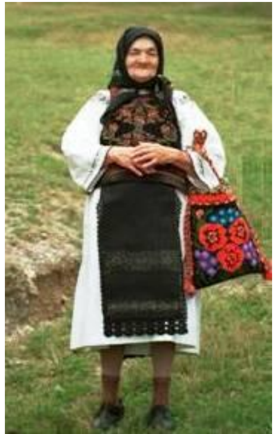
Costum bătrânesc din Sângeorz-Băi