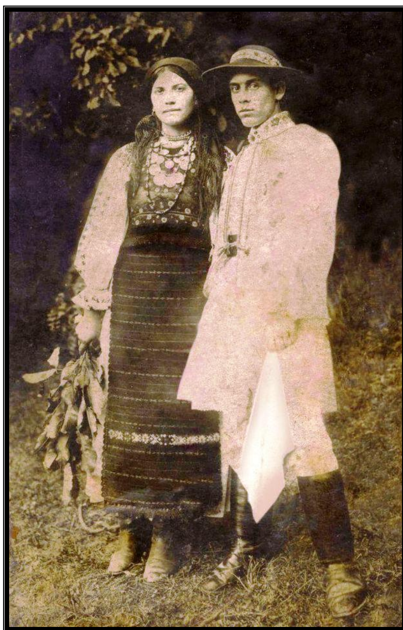
Tineri din Sângeorz-Băi, 1940

Această subzonă este situată pe cursul superior al Someșului Mare, la poalele Munților Rodnei, având câteva microdepresiuni, precum Șanț, Rodna, Maieru. De aici izvorăște râul Someșul Mare, prima lărgire a văii cănturându-se la confluența cu Valea Măriei. În zona afluenților Borcut și Cormaia se găsește a altă microdepresiune, cea a orașului Sângeorz-Băi.