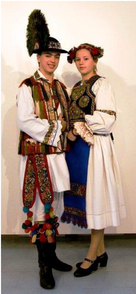
Tineri din Sângeorz-Băi (Ansamblul folcloric „Păunița”)

Ornamentul acestora este format din trei galbene și trei cinceșe (un anumit model pe vergi sau vârste), având la marginea de jos cănaci făcuți cu mâna pe draniță . Mai nou, printre vergi, se cos mărgele.