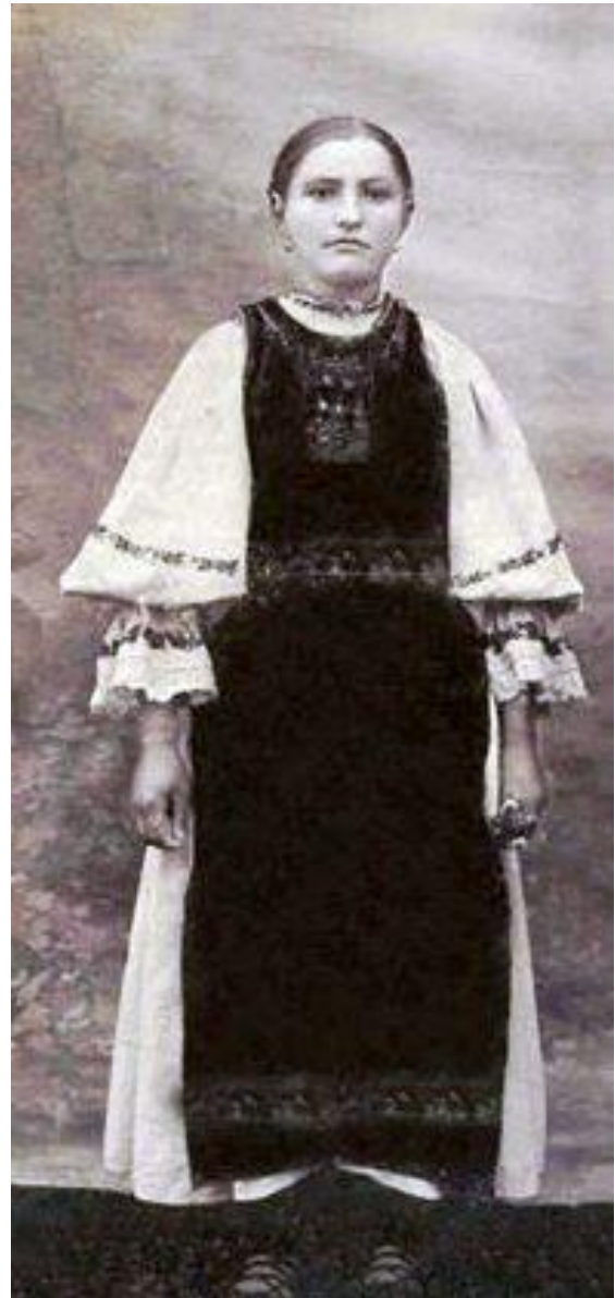
Fată din subzona Rodna

Șurțul este confecționat din păr , din lână moale, feștită braun , cu ornamente doar la poală, 10 cm., și se poartă în față. Există și șurț roșu (mai vechi) cu patru galbene și patru cinceșe .