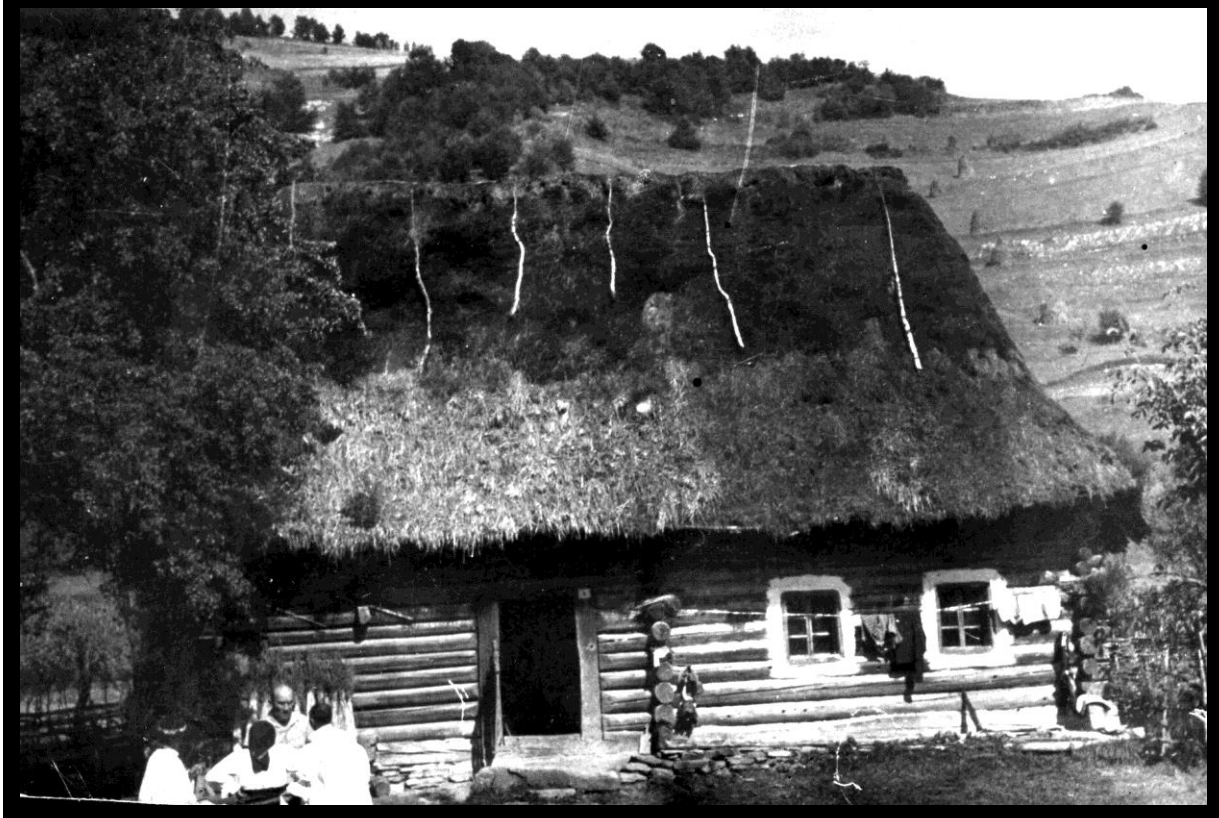
Fotografie din colecția artistului Maxim Dumitraș