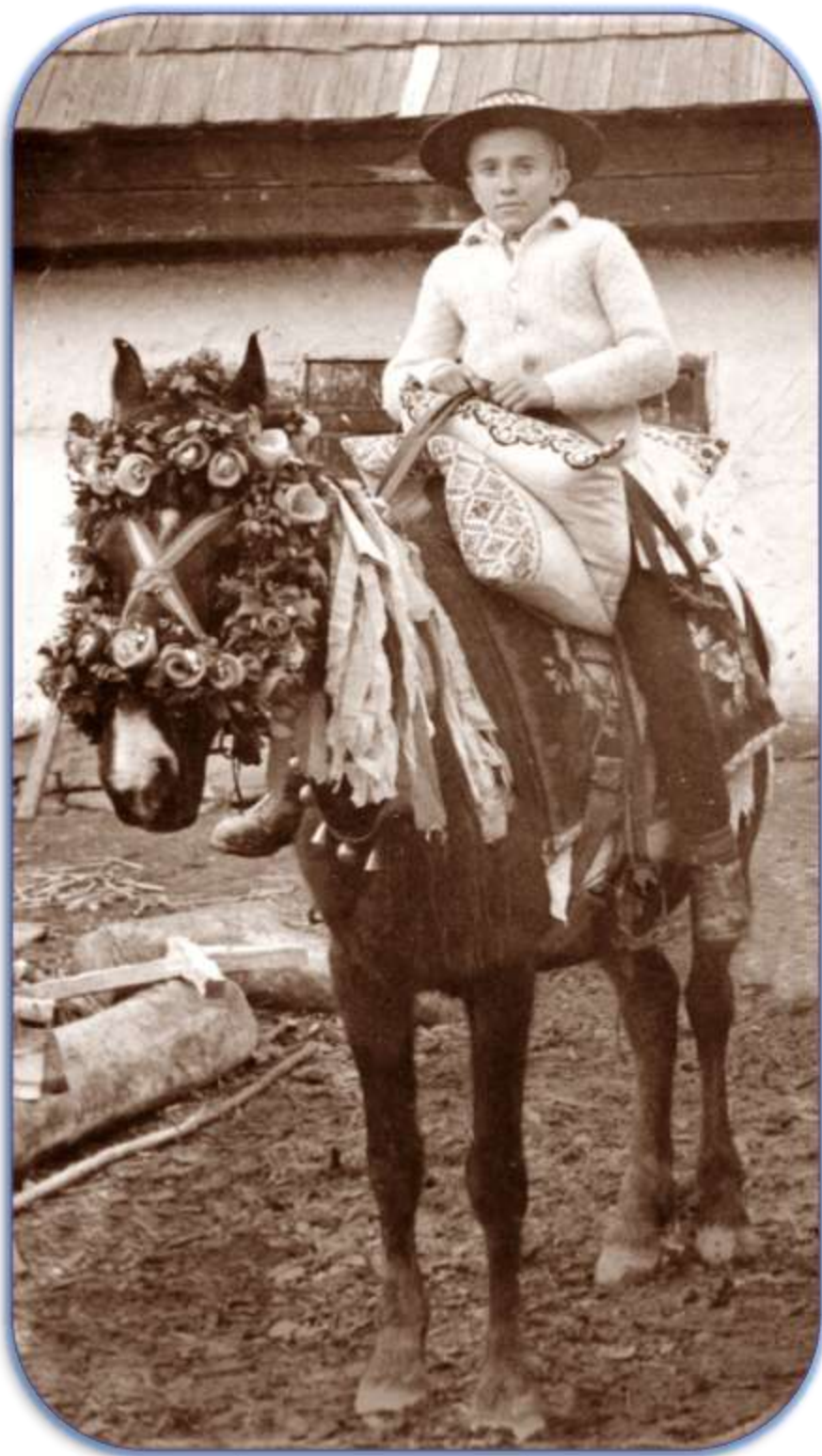
Fotografie din colecția artistului Maxim Dumitraș