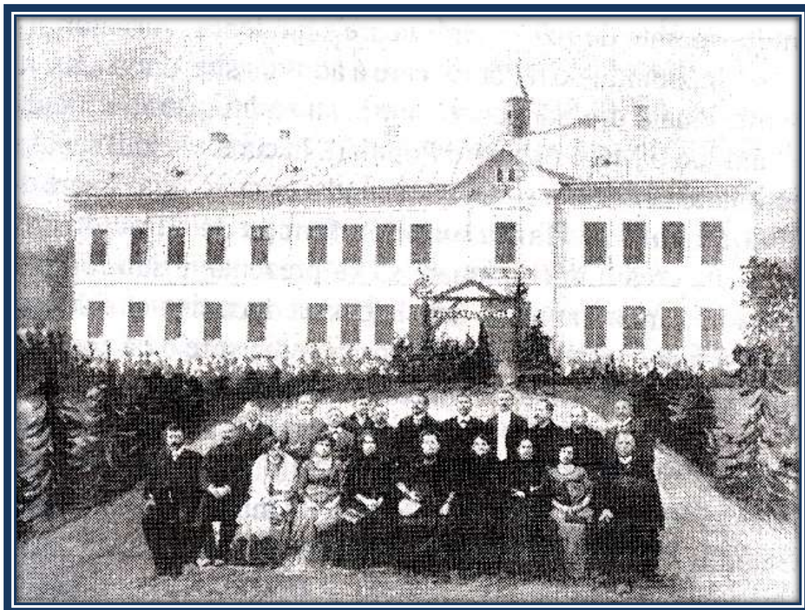
Fotografie din colecția artistului Maxim Dumitraș