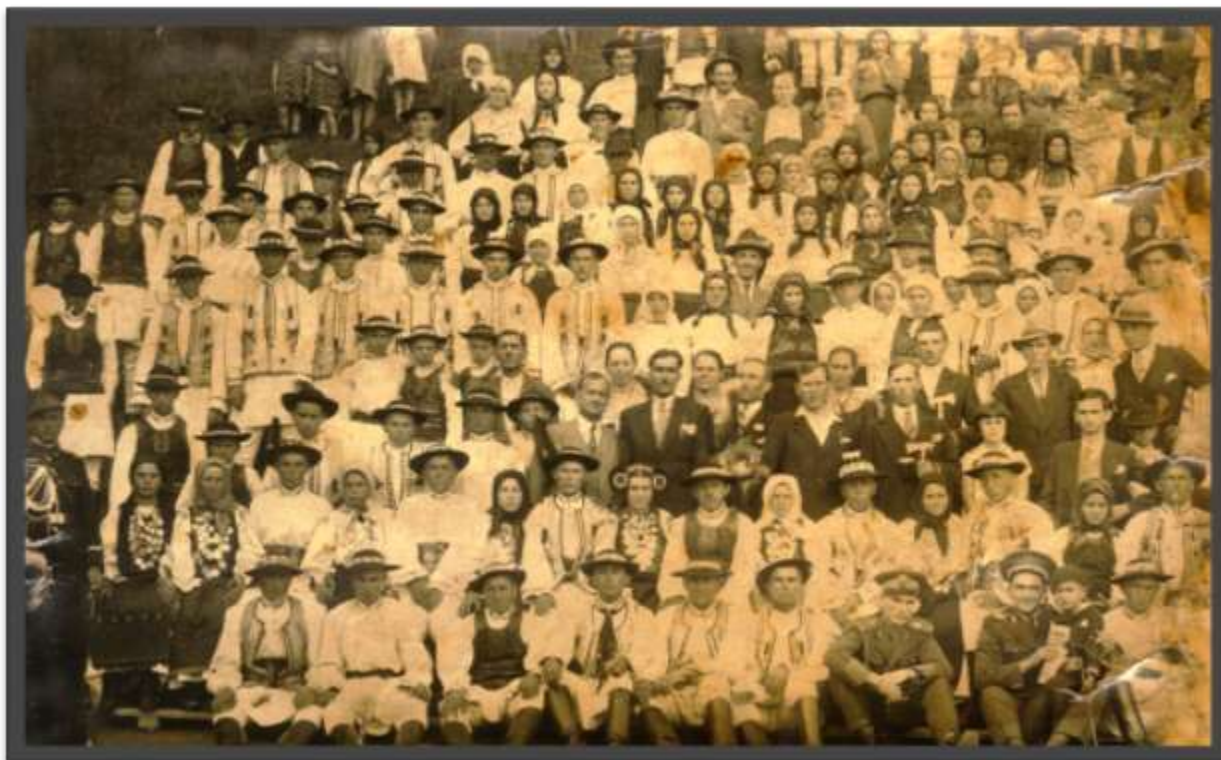
Fotografie din colecția artistului Maxim Dumitraș