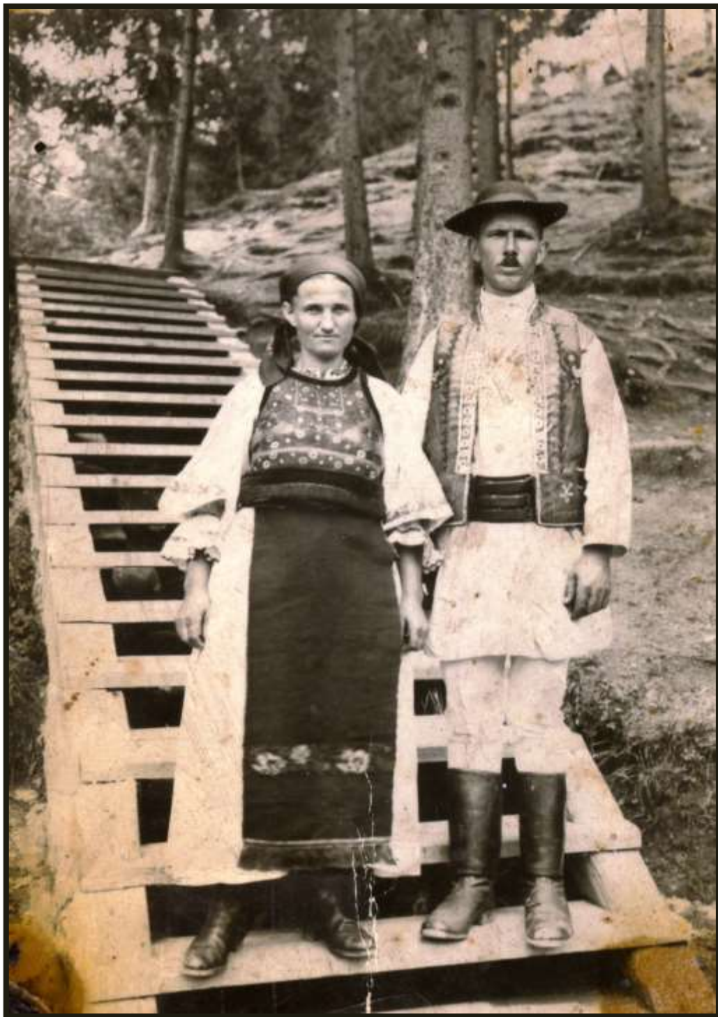
Fotografie din colecția artistului Maxim Dumitraș