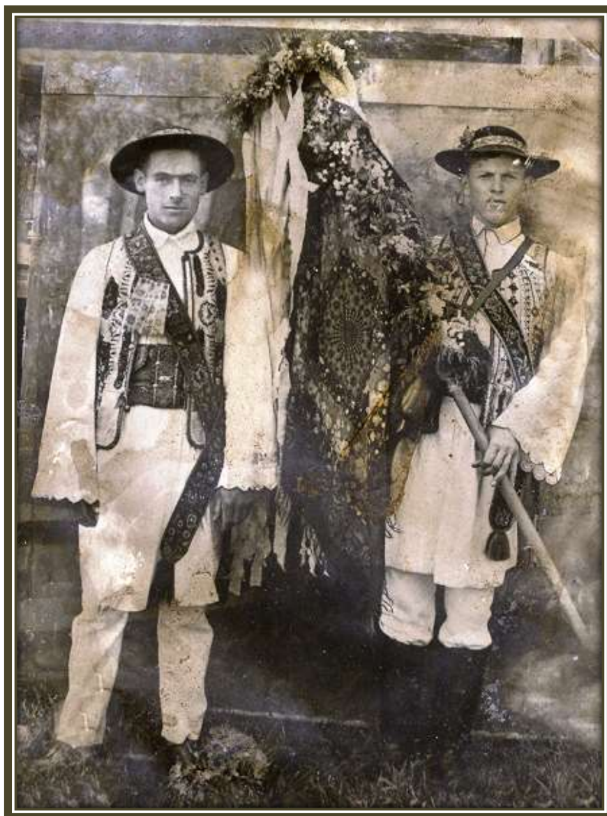
Fotografie din colecția artistului Maxim Dumitraș