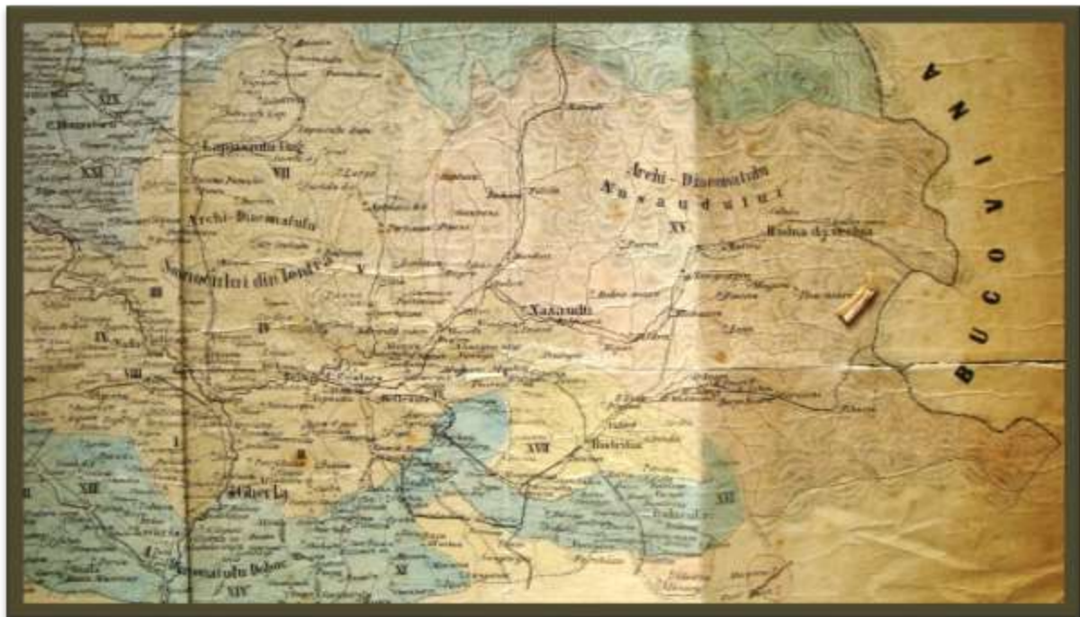
Fotografie din colecția Dorin Dologa