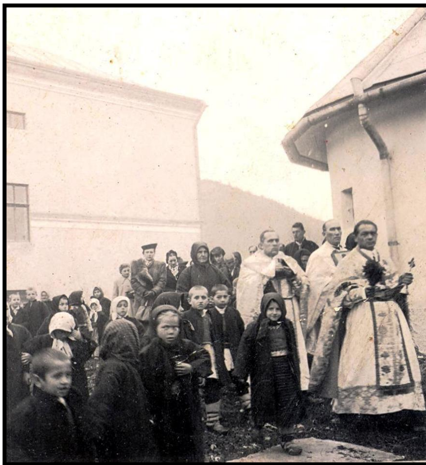
Slujba de binecuvântare a bisericii greco-catolice din Feldru după lucrările de reparații care au avut loc în anul 1943