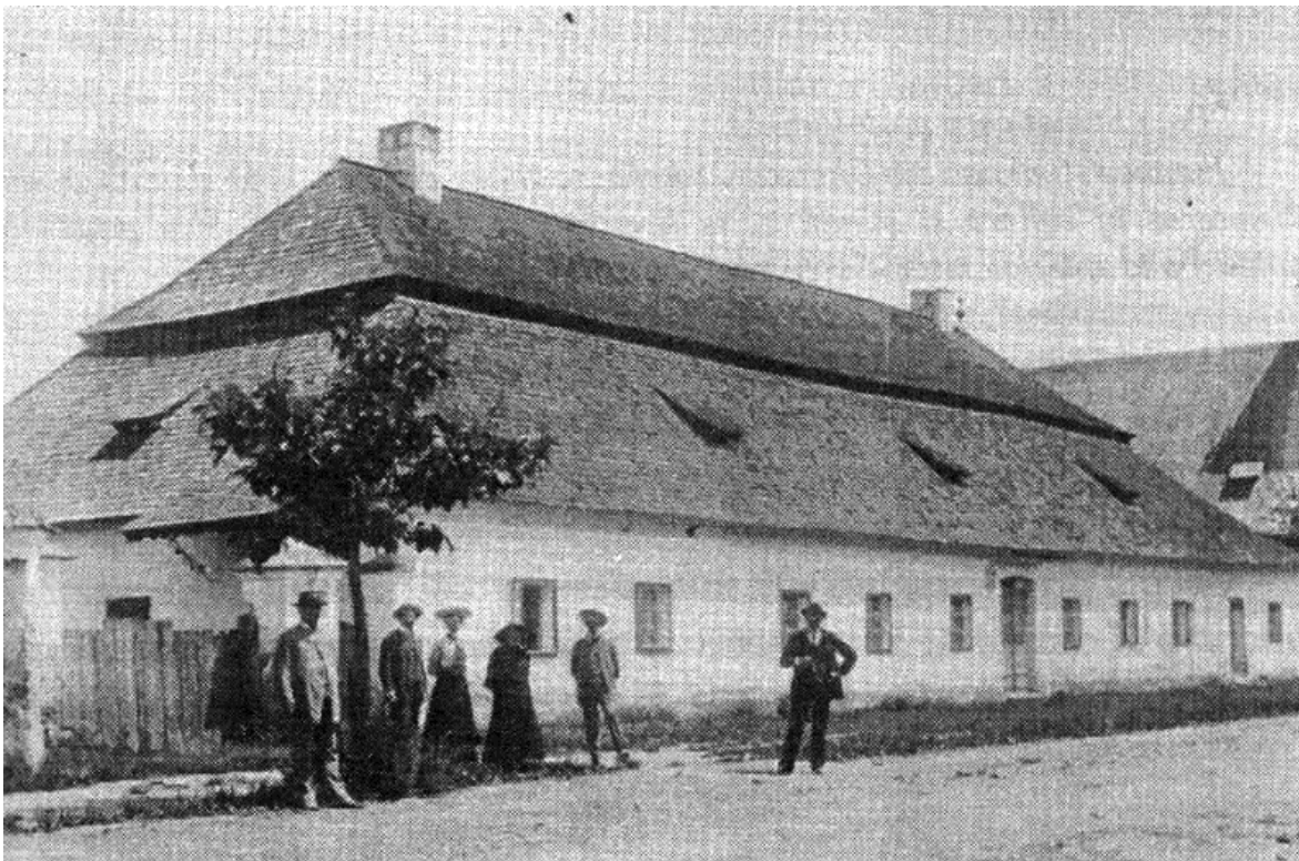
Prima clădire în care a funcționat Gimnaziul Grăniceresc din Năsăud, începând cu 1863