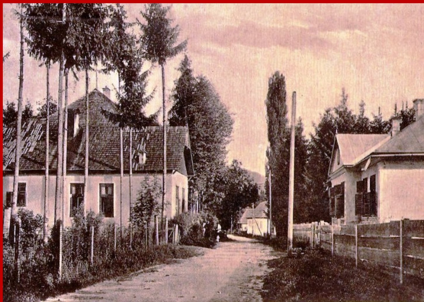
Băile Sângeorz, jud. Pășăud