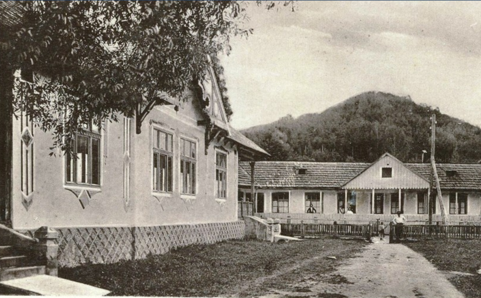
Băile Sâncgeorz, jud. Pásăud