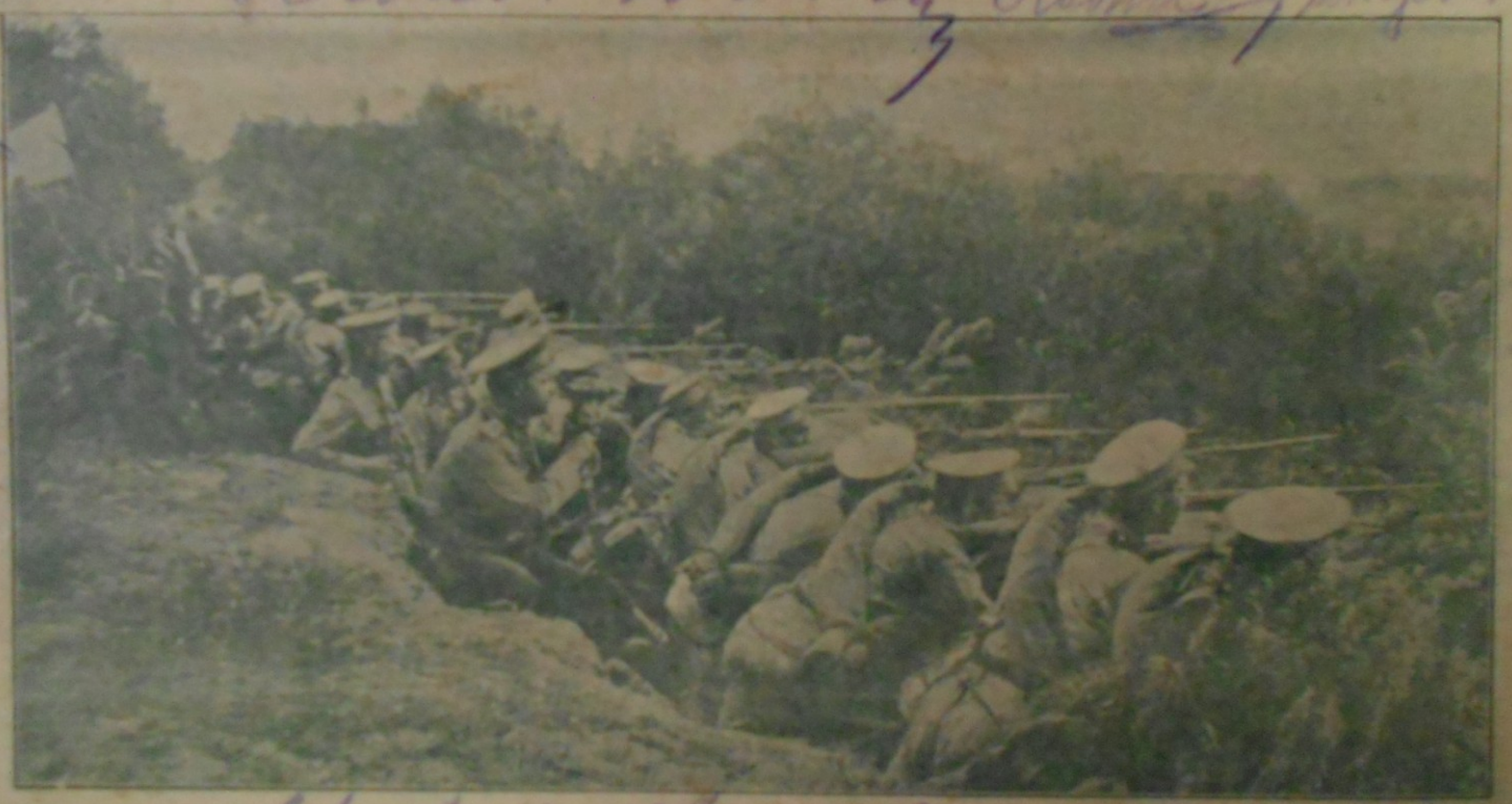
Въ окопѣ. Arbuturi născu pentu Im Schützengraben. comata născu prozitate paulari acoperit cu născu născu