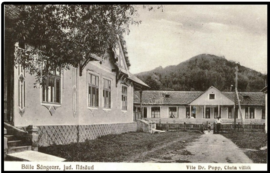
Băile Sângeorz, jud. Năsăud