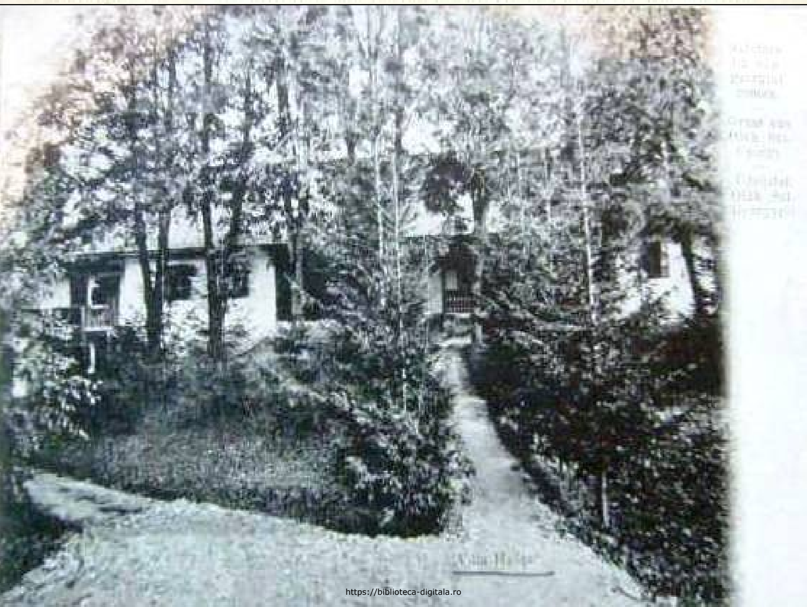
Băile calde și reci - Hideg és meleg fürdők - Kalte u. warme Bäder