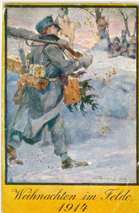
Carte poștală reprezentând Știri de acasă împărțite de furier pentru cei de pe front