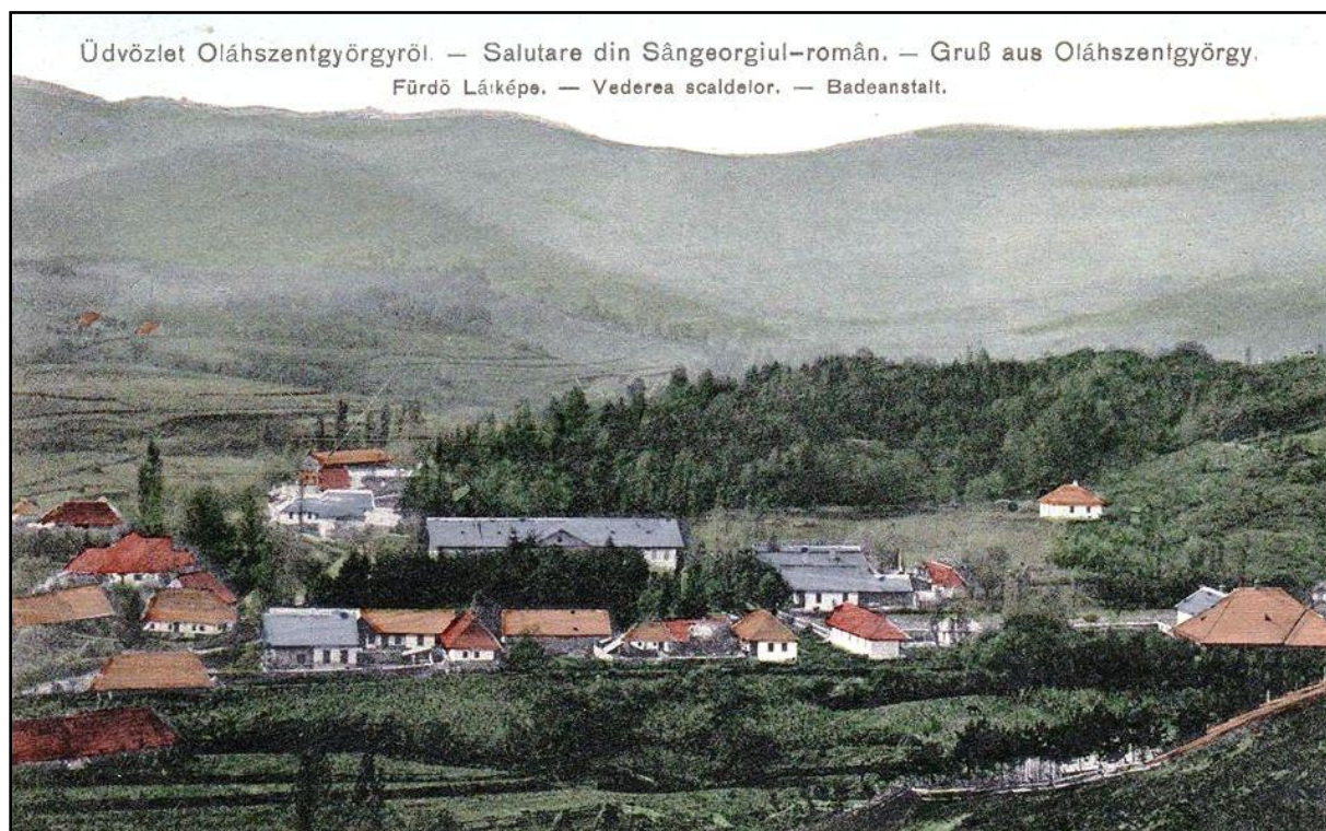
SÂNGEORZ-BĂI: Vedere generala a Scaldelor Carte poștală colorizată, circulată în 22.07.1911

Distanța de la Gherla la Bistrița, cu calea ferată, este de două ore, iară de la Bistrița la Oradea-Mare m-am reîntors în 10 ore 2 .