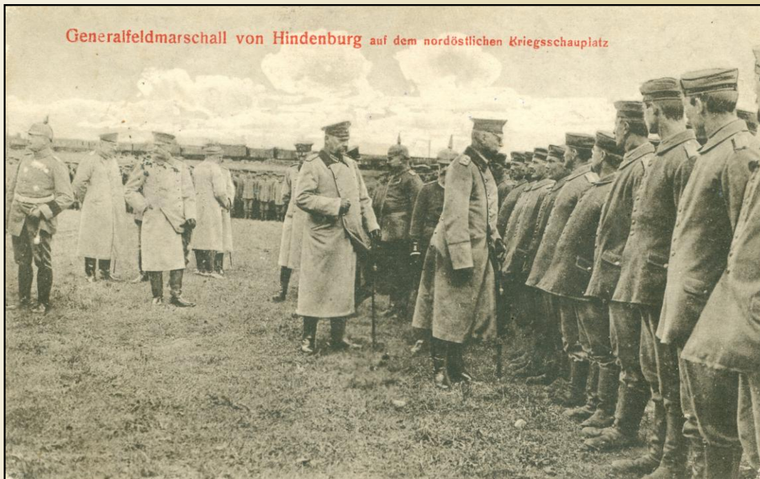
1916, decembrie, 22 - Generalul - Feldmareșal Hindenburg, care trece în revistă o unitate militară pe frontul de nord