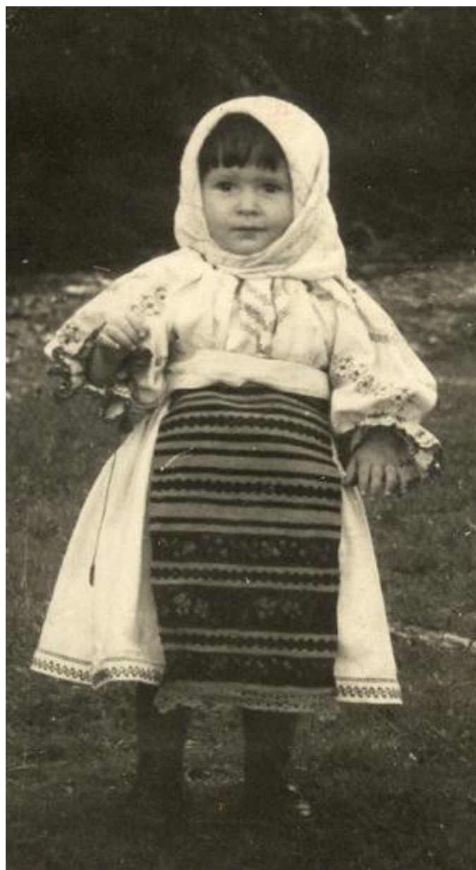
Fotografie din colecția artistului Maxim Dumitraș