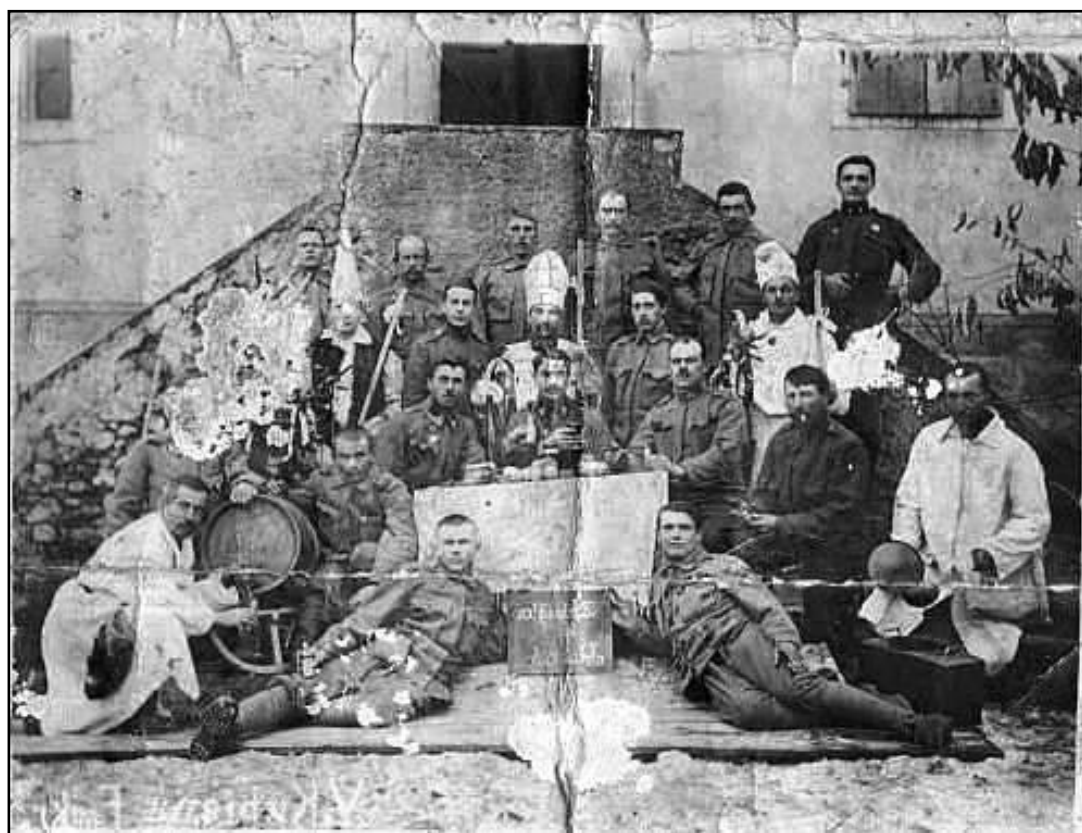
Locuitori din comuna Șanț în Primul Război Mondial