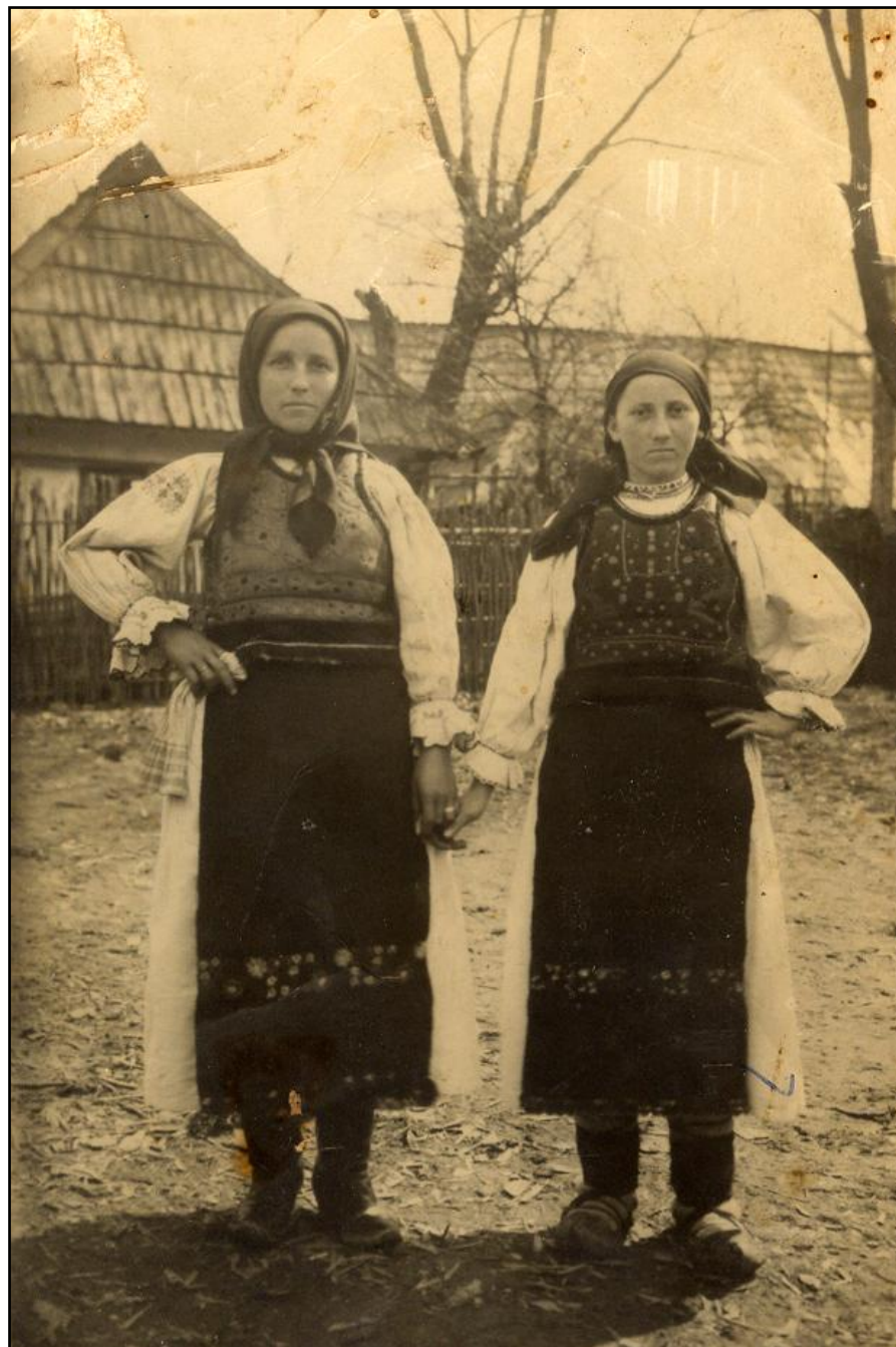
Fotografia din colecția artistului Maxim Dumitraș